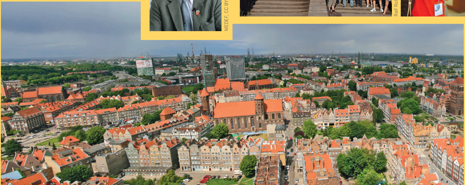
Michał Stupczewski, CC BY SA 3.0