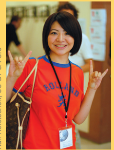
Ralf Rolletschek, CC BY SA 3.0