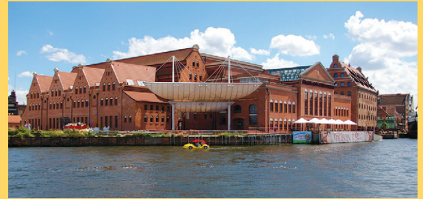
Lukasz Golowanow, CC BY SA 3.0