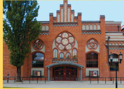
Lukasz Golowanow, CC BY SA 3.0

あちこちに見られたコンファレンスTシャツには、「フリー・シティのフリー・ナレッジ (Free Knowledge in the City of Freedom)」というモットーが掲げられ、1980年代にレフ・ワレサが率いた「連帯」運動が共産主義支配者たちに抵抗したグダニスクの歴史とウィキメディアの価値観を関連付けました。レフ氏は、自分でもウィキペディアを頻繁に利用することを述べる、挨拶状をウィキマニア参加者に送っています。