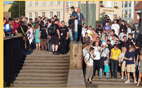
Ralf Rolletschek, CC BY SA 3.0