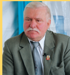
MEDEF, CC BY SA 2.0