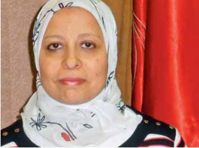
لفارس الحويلي (CC-BY-SA 3.0)

وقد تعلم الطلاب التفوق في مجالات الترجمة التخصصية ومعرفة الجوانب النظرية والعملية لهذه المجالات. لقد فهموا ضرورة تطوير مهاراتهم والمشاركة في الممارسة المتواصلة للعمل في مجموعات والتعامل مع الأدوات التكنولوجية مثل الإنترنت من أجل جمع المعلومات.