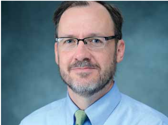
(Kevin Bain) لكيفن بين (CC-BY-SA 3.0)

تم تقييم أعمال الطلاب من ناحية المشاركة في كل مرحلة من عملية تنفيذ المهمة، وكذلك من ناحية المقال التأملي. وفي كل مرحلة من مراحل المهمة السبع، طلب من الطلاب إجراء نوع من البحث ثم إعداد تقرير موجز لمهمة ذلك اليوم. وفي المقال التأملي طلب من الطلاب تقييم المشروع من ناحية فائدته في مساعدتهم على الوصول إلى نتائج المقرر الدراسي. وقد ساهمت هذه الإستراتيجية المتمثلة في إنشاء مهام صغيرة متزايدة للكتابة من أجل التعلم كل يوم على توفير مهام سهلة التنفيذ بصفة يومية ولا تشتت انتباه الطلاب عن عملية البحث.