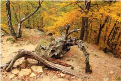
(CalaLoh) لكالالو (CC-BY-SA 3.0)