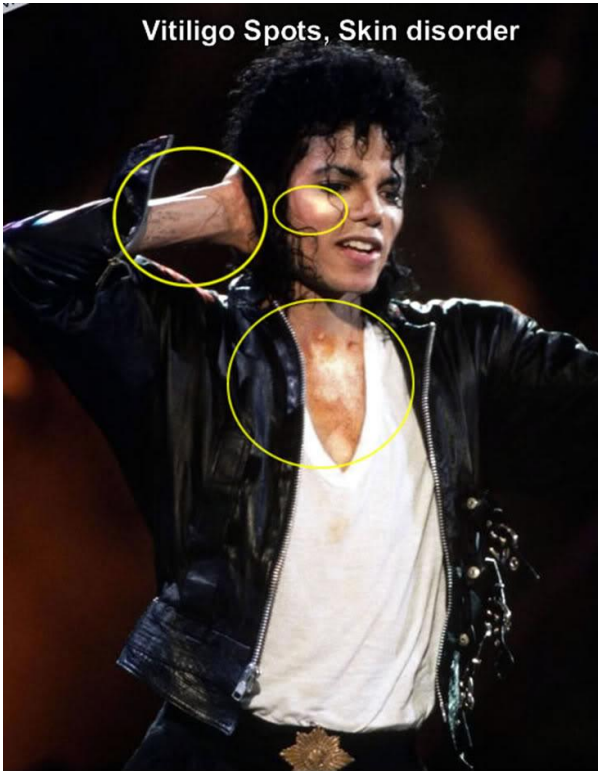
Aqui se puede ver el Maquillaje corrido en los bordes del guante, por ocultar manchas en las manos