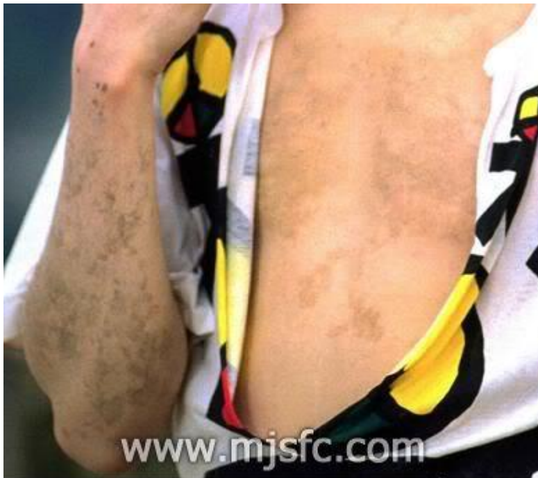
Aqui se observa perfectamente el Vitiligo en zona del pecho y parte anteroposterior de los brazos