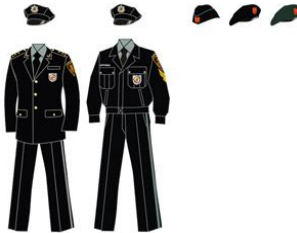
ყოველდღიური საგაზაფხულო-საშემოდგომო ფორმა

წოდების შესაბამისი ფურნიტურა და ატრიბუტიკა.