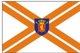
დაცვის პოლიციის დეპარტამენტის დროშა