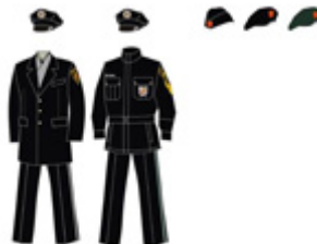
ყოველდღიური ზამთრის ფორმა

წოდების შესაბამისი ფურნიტურა და ატრიბუტიკა.