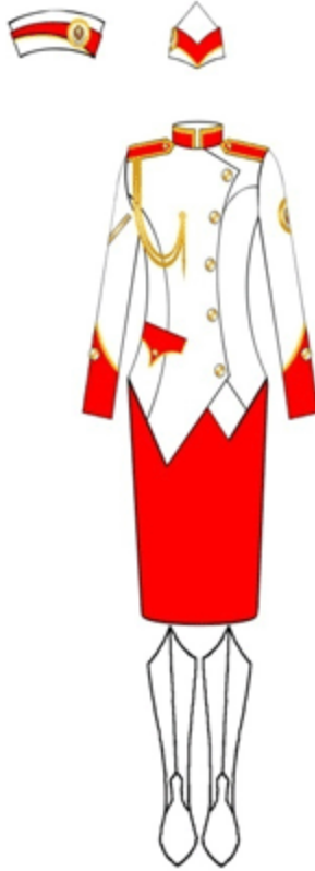
სააღლუმო გამოსასვლელი (სარიტუალო) ფორმა