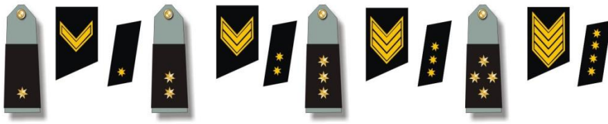
პოლკის უფროსი ლეიტენანტი