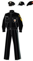
ყოველდღიური ზამთრის ფორმა

წოდების შესაბამისი ფურნიტურა და ატრიბუტიკა.