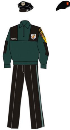
ყოველდღიური ზამთრის ფორმა

შავი ფერის დათბუნებული კეპი; შავი ფერის პილოტური ქუდი, დამცავი (რუხი-მწვანე ტონალობის) ფერის კანტით; შავი ფერის ბერეტი; მუქი დამცავი (რუხი-მწვანე ტონალობის) ფერის ბერეტი; თეთრი მაისური ან მაისურის გარეშე; შავი ფეხსაცმელი. (ან მაღალყელიანი დათბუნებული ფეხსაცმელი). წოდების შესაბამისი ფურნიტურა და ატრიბუტიკა