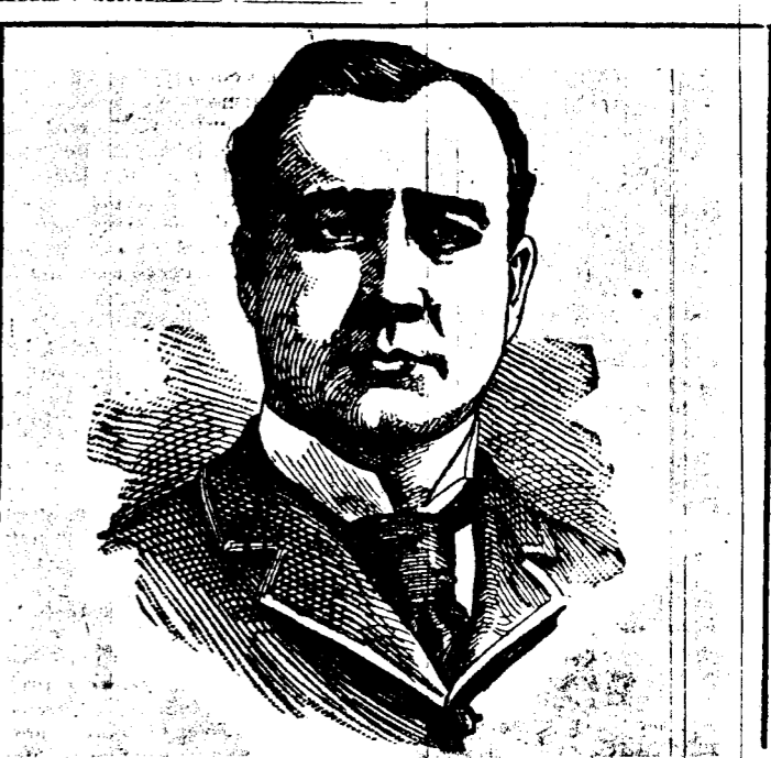
L'HON. HOKE SMITH. Le Ministre démissionnaire.

Indianapolis, Indiana, 3 septembre.—Le programme ad hoc par le comité des résolutions se déclare par le simple glissement d'or, avec la frappe de monnaies divisionnaires d'argent de façon à ne pas altérer la parité entre les deux métaux.