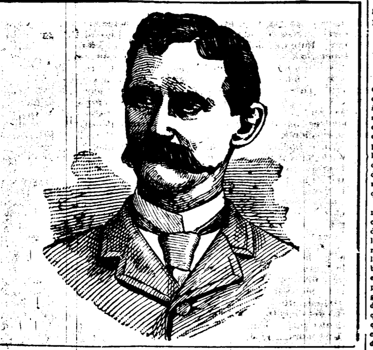
DAVID B. FRANCIS. Ministre de l'Intérieur.

On sait que la question des menus est une grosse question, peut-être la principale des voyages présidentiels.