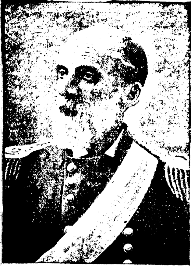
Général JOE WHEELER.

...prêts à ramener cette foule de visiteurs chez eux. Hier, bien des départs ont eu lieu, mais de ceux qui ne sont pas fatigués, ont été sur pied.