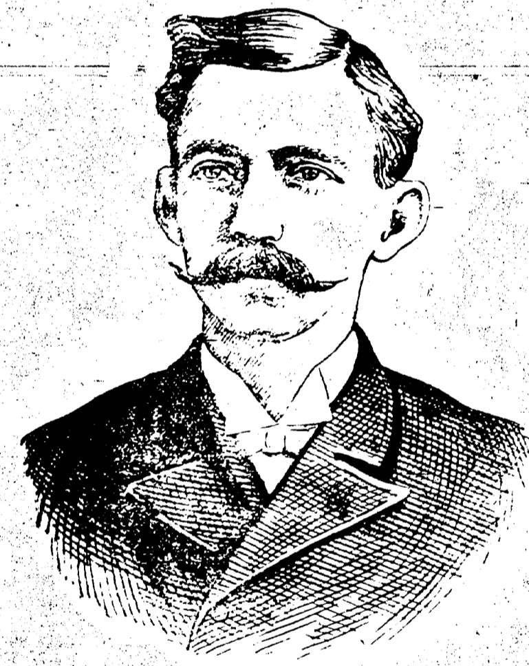
Gov. W. W. HEARD.

Les vétérans n'ont pas été seuls à nous quitter depuis deux jours, mais c'est à partir d'hier soir que les trains se sont remplis de nos hôtes de passage habituels.