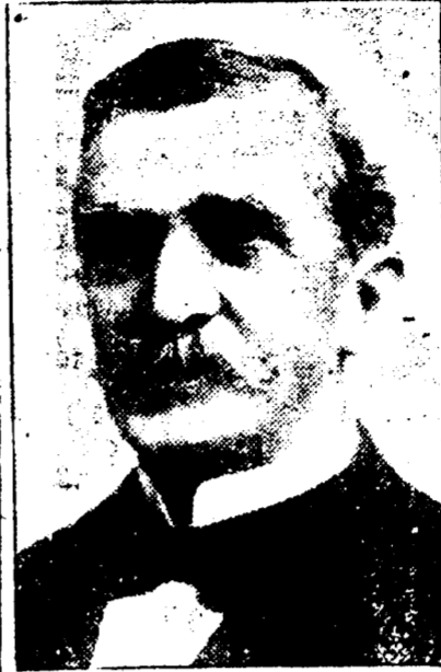
EMILE S. ECUYER Président de l'Union Française.

DATES DES REUNIONS — Réunions le premier jeudi de chaque mois.