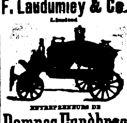
F. Laudumiey & Co. 1108 et 1112 Nord Rampart. Spécialité de pompes funèbres.