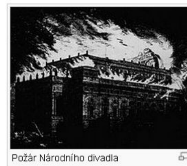
Požár Národního divadla

Noviny už ale vyzývají, aby Češi nezoufali. „ Národní divadlo bylo. Národní divadlo bude, “ ujišťují Národní listy .