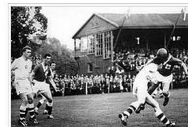
Čechoslováci (v bílém) na Severní Irsko nestačili