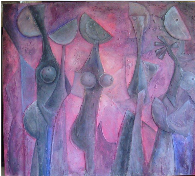
( "Cementerio de musas despreciadas", técnica mixta, 100 x 80 cm)