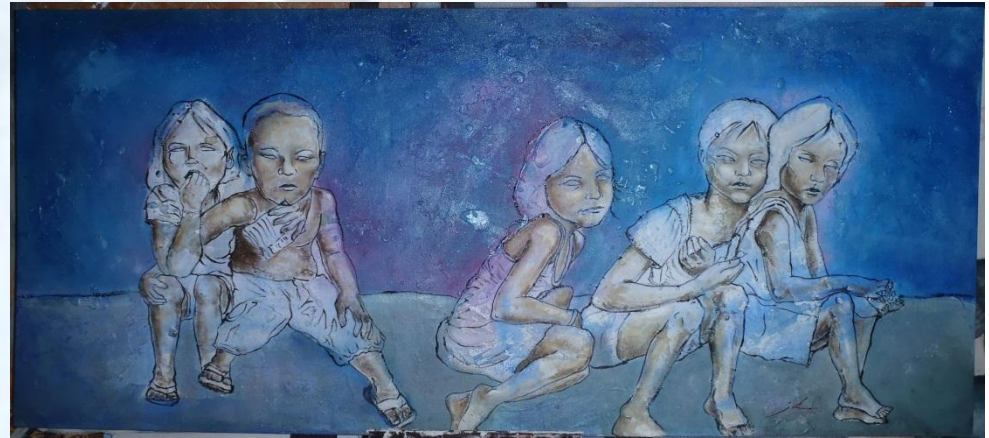
De la calle

Mural en Demacú, México, en el festival de arte FIESTA PARA EL MESQUITAL ( donde es invitado todos los años)