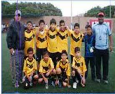
Equipo "Cercado de Lima"