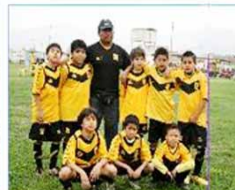
Equipo "San Juan de Lurigancho 2"

Además participó el equipo de "Noguchi B".