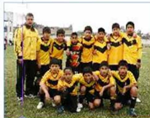
Equipo "San Juan de Miraflores"