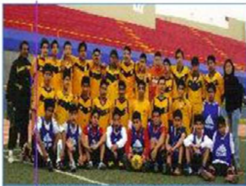
Equipo "Callao B": Primer Puesto