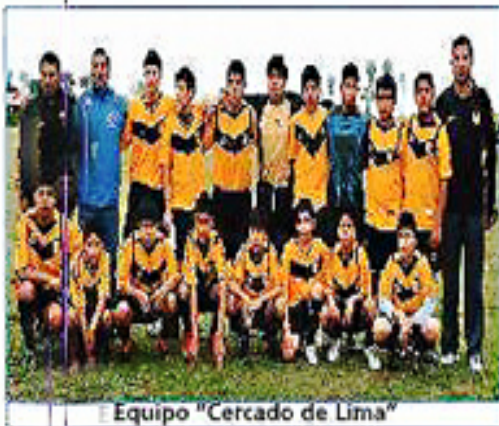
Equipo "Cercado de Lima"

También participaron los equipos de CALLAO B (1º puesto), SAN MARTIN DE PORRES (3º puesto), NOGUCHI (4º puesto) y CALLAO C