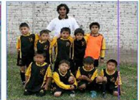
Equipo "San Juan de Miraflores"