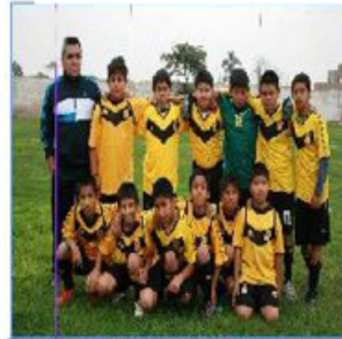
Equipo "Comas 2"