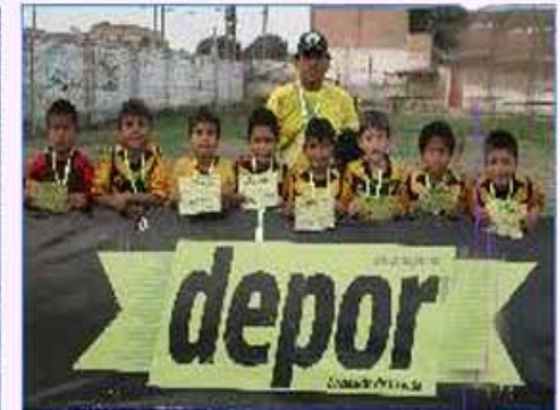
Equipo "Chorrillos": Segundo Puesto