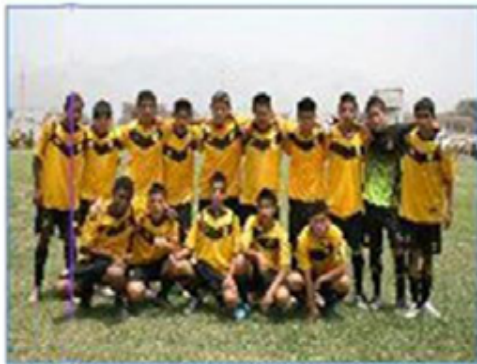
Equipo "San Juan de Lurigancho 1"