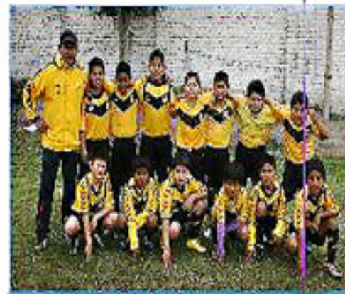
Equipo "SMP": Cuarto Puesto