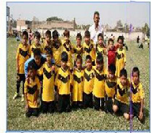
Equipo "Noquchi B": Cuarto Puesto