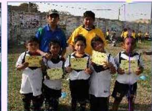
Equipo "San Luis": Cuarto Puesto