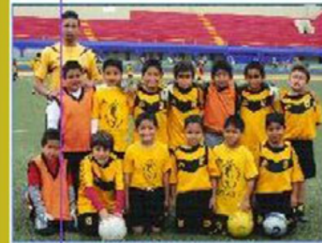
Equipo "Callao B"