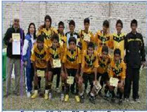
Equipo "Callao B": Primer Puesto