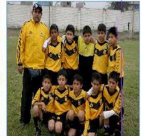
Equipo "San Martín de Porres"

Además participaron los equipos de "Monterrico", "Puente Piedra", "Chorrillos", y "Chorrillos 2".