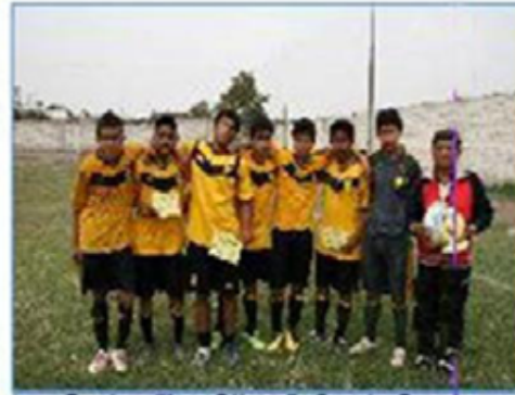
Equipo "Los Olivos": Cuarto Puesto