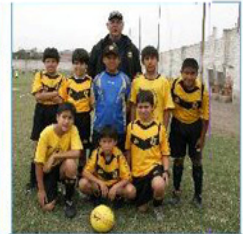
Equipo "Jesús María"