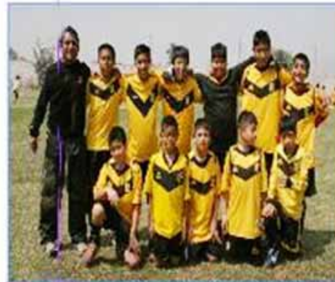
Equipo "Callao B": Tercer Puesto