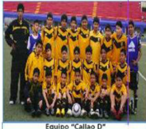
Equipo "Callao D"

Además participaron los equipos de "San Luis" (1er Puesto), "Los Olivos" (2do Puesto), "Callao B" (3er Puesto), "SMP" (4to Puesto), y "Puente Piedra"