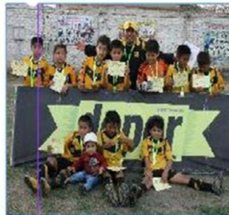
Equipo "Noguchi A": Primer Puesto