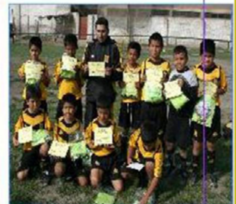
Equipo "SJM 1": Cuarto Puesto