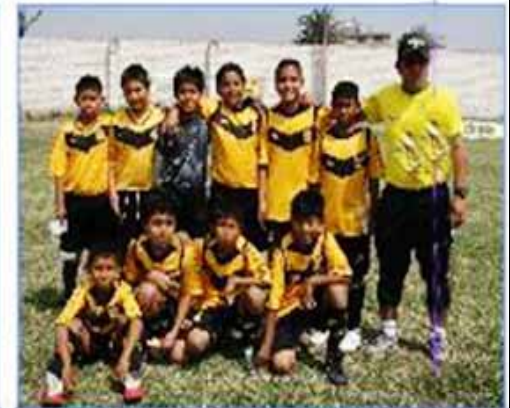
Equipo "SJM 1": Cuarto Puesto