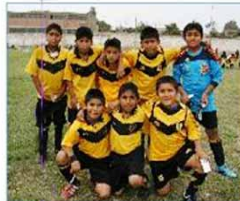
Equipo "Noguchi B"