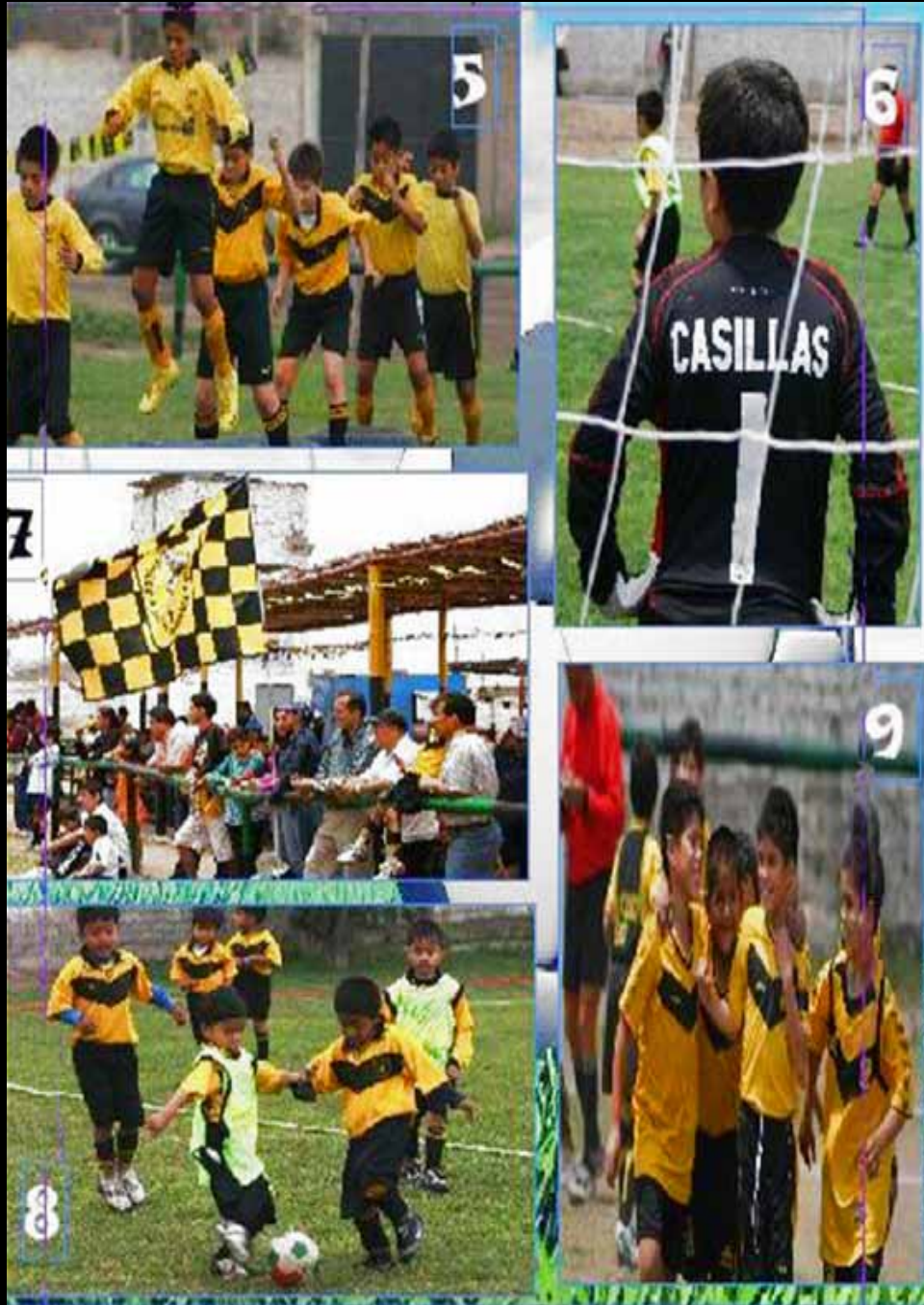
5. También espacios para jugar Los que no se cansan de alentar