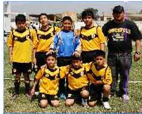
Equipo "SMP": Cuarto Puesto