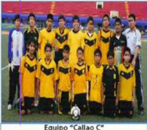
Equipo "Callao C"