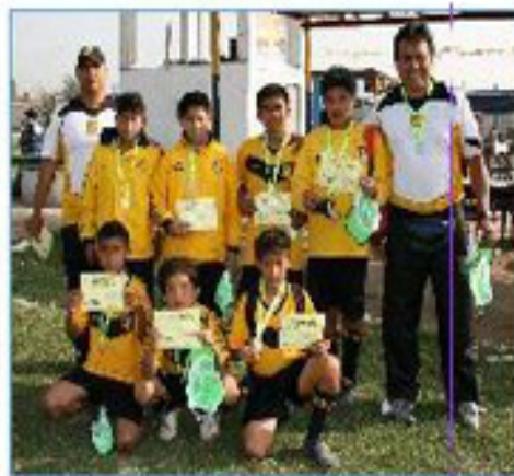
Equipo "Los Olivos": Segundo Puesto

Contamos con 23 sedes en Lima, 4 en provincias y 3 en el exterior. Todos cuentan con la continua asesoría y supervisión de la Dirección General de la AD Cantolao.