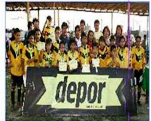
Equipo "SJM": Segundo Puesto