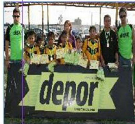
Equipo "Surquillo": Tercer Puesto