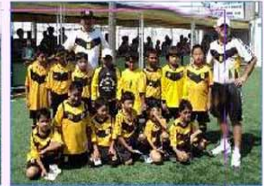
Equipo "San Juan de Lurigancho"

Además participaron los equipos de "Callao C", "San Martín de Porres", y "San Juan de Miraflores".