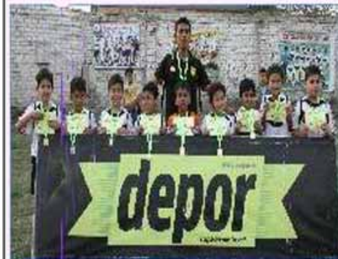
Equipo "Monterrico": Primer Puesto