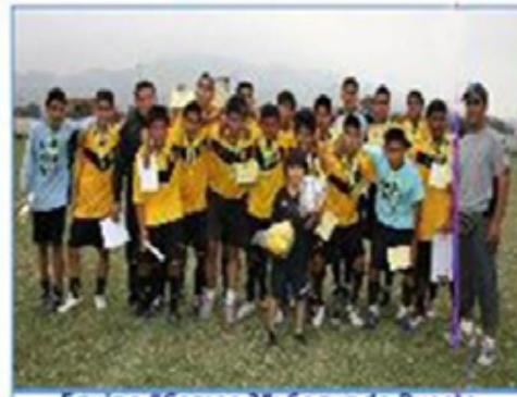
Equipo "Comas 2": Segundo Puesto