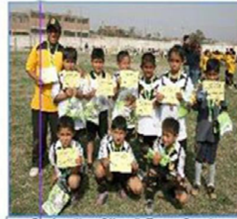
Equipo "Los Olivos": Tercer Puesto