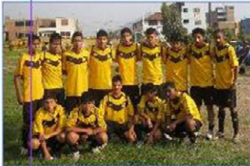
Equipo "San Juan de Lurigancho 2"

Además participaron los equipos de "Callao C", "Puente Piedra", y "San Martín de Porres".