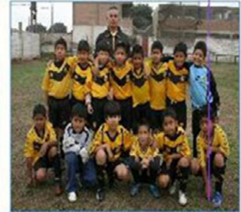
Equipo "Callao B": Segundo Puesto