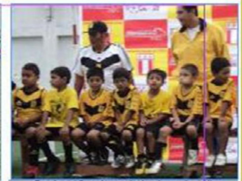
Equipo "San Juan de Lurigancho"