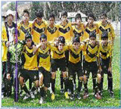
Equipo "Los Olivos": Segundo Puesto