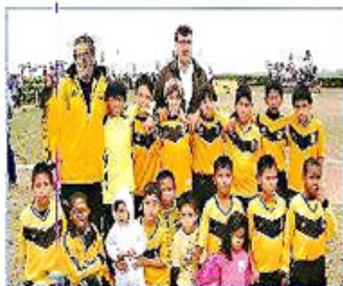
Equipo "SJM": Primer Puesto