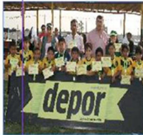
Equipo "Noquchi A": Primer Puesto