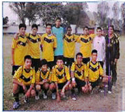
Equipo "San Juan de Lurigancho"