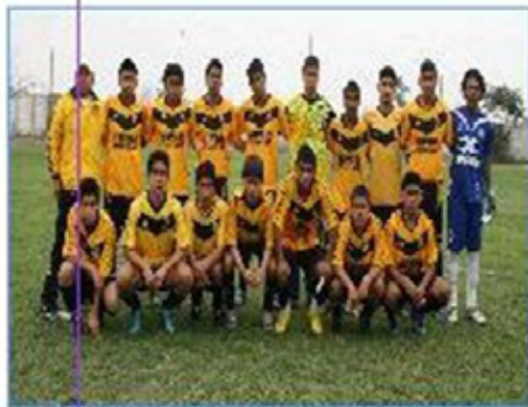
Equipo "Callao C": Tercer Puesto