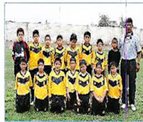
Equipo "Callao C"