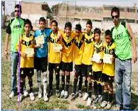
Equipo "Callao B": Tercer Puesto