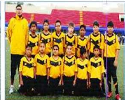
Equipo "Callao C"