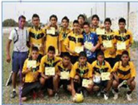
Equipo "Noguchi": Tercer Puesto