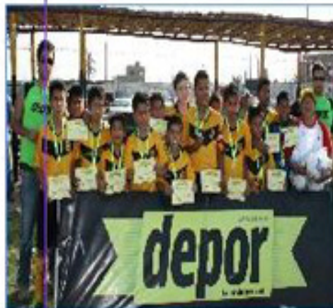
Equipo "Noguchi A": Primer Puesto