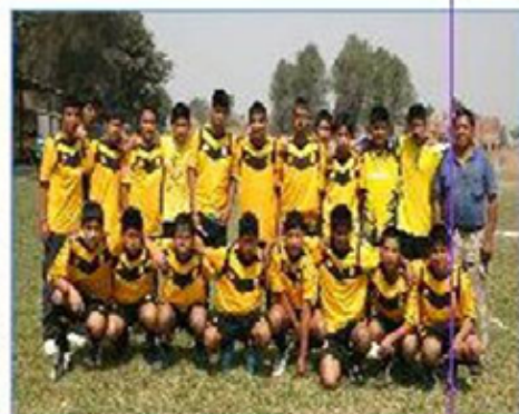
Equipo "Puente Piedra"