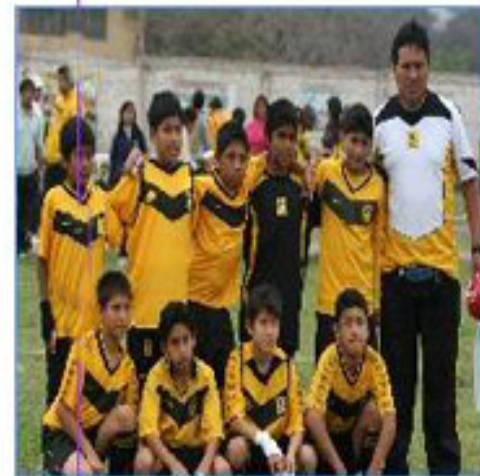
Equipo "Los Olivos"