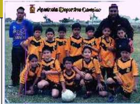
Equipo "Cercado de Lima"