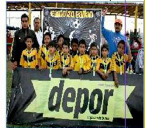
Equipo "Callao B": Segundo Puesto