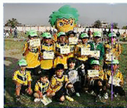
Equipo "Comas 2": Segundo Puesto