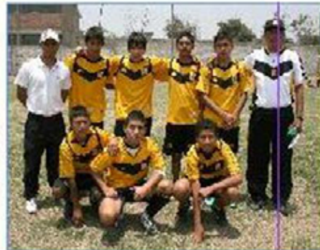
Equipo "SJL 1": Segundo Puesto