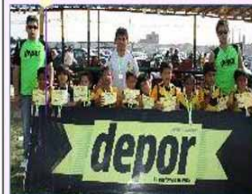
Equipo "Comas 2": Tercer Puesto