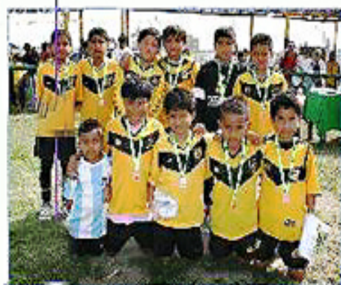
Equipo "Callao B": Tercer Puesto