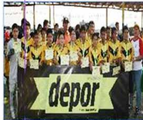
Equipo "Noguchi A": Primer Puesto