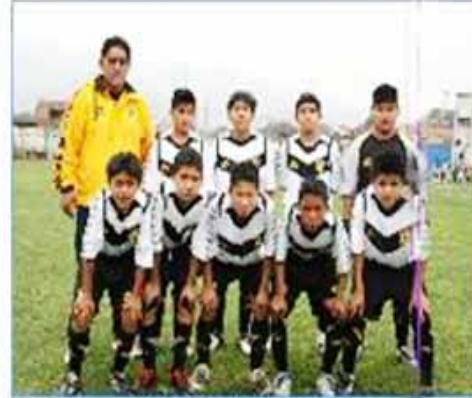
Equipo "San Luis"