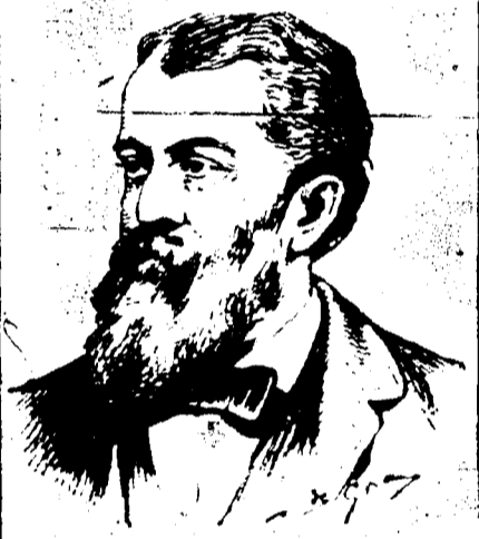
M. Brisson est réélu président de la Chambre

Paris, 11 janvier.— M. Henri Brisson a été réélu hier président de la Chambre des Députés, par 270 voix contre 197 données à M. Paul Deschanel.