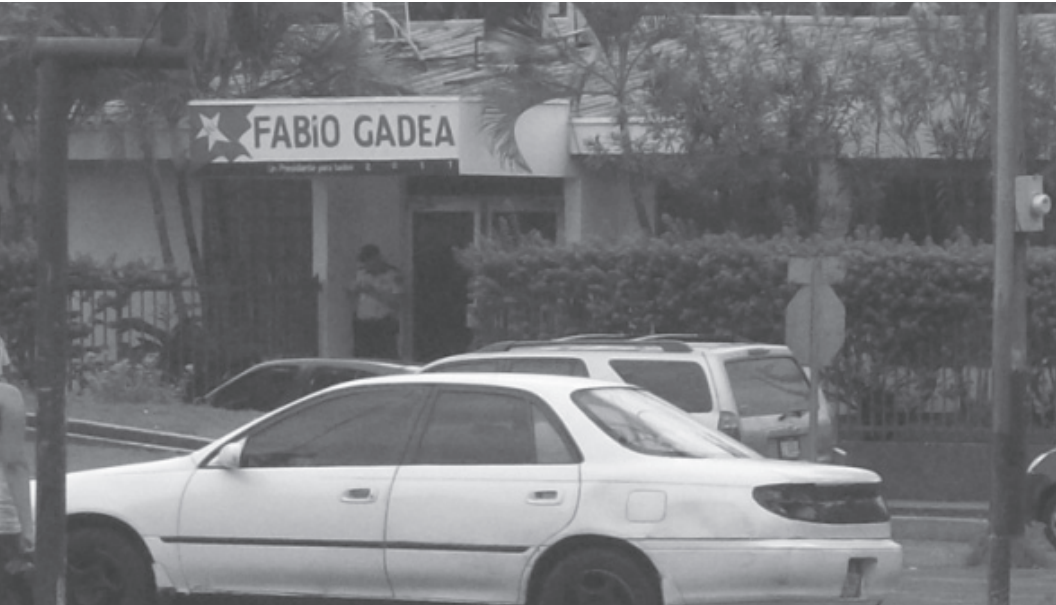
Fotografía Central de la Casa de Campaña Alianza PLI-MRS (Fabio Gadea Mantilla), ubicada de Plaza El Sol dos cuadras al lago, mano izquierda; donde se instalaron Dos E1 de Claro Enitel.