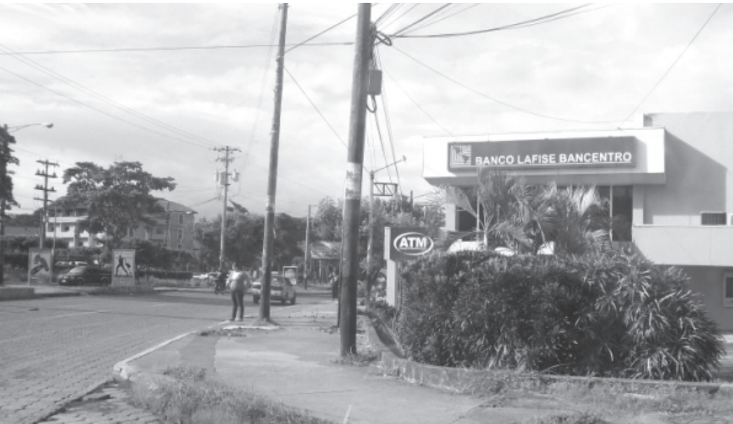
Fotografía de orientación, donde se aprecia el Edificio Banco LaFise Bancentro y detrás de este, el Edificio de la Empresa Soluciona.