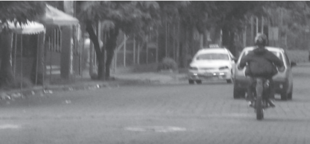
Fotografía de orientación, donde se aprecia calle y parte del inmueble (Casa de Campaña Alianza PLI-MRS).

Como parte del plan general para crear confusión, desorden y caos, los Fiscales de la Alianza PLI fueron orientados para no firmar las Actas de Escrutinio, destruir Actas de Cierre y Escrutinio e introducir masivos recursos de impugnación o revisión en los centros de votación donde los resultados no les fueran favorables.