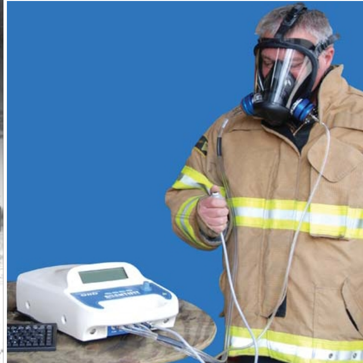
Проверка с помощью поддержания постоянного разрежения под маской, портативный прибор Quantifit (изготовитель - OHD). 2011г