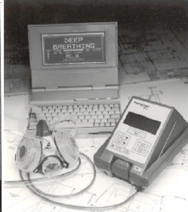
Портативный прибор для проверки с помощью естественного атмосферного аэрозоля счётчиком ядер конденсации – PortaCount (TSI Inc.) 1999г