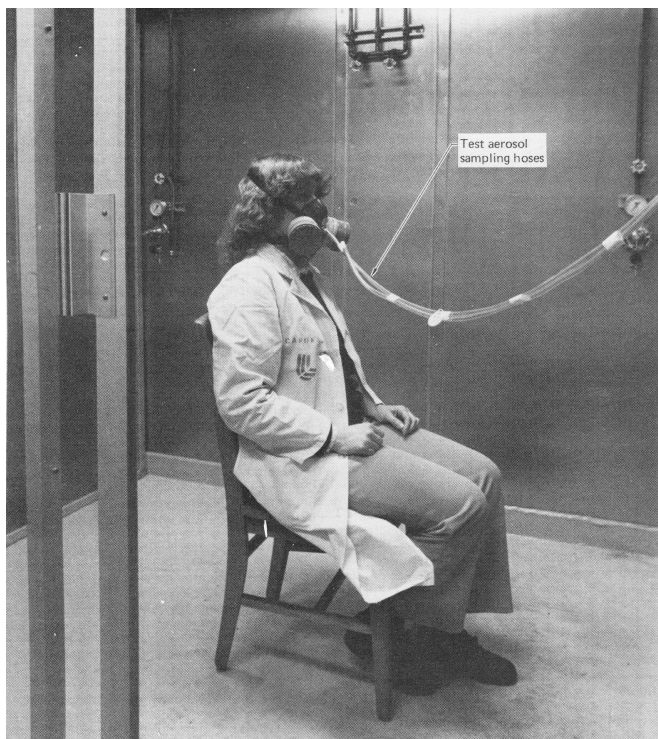
Проверка в лаборатории в специально оборудованном помещении с помощью искусственно созданного аэрозоля. 1983г