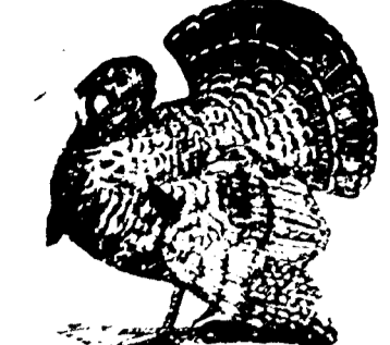
Le jour de Thanksgiving

"J'espere bien qu'avant peu ils apprendront, a leurs depens, la verite du proverbe qui affirme qu'il y a loin de la coupe aux levres. Je l'attends a midi au restaurant Poupard. Ton devoue "Eugene LIVET."