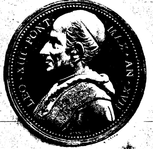
Fac-similé de la Grande Médaille d'Or donnée par S. S. le Pape Léon XIII, à M. A. Mariani.