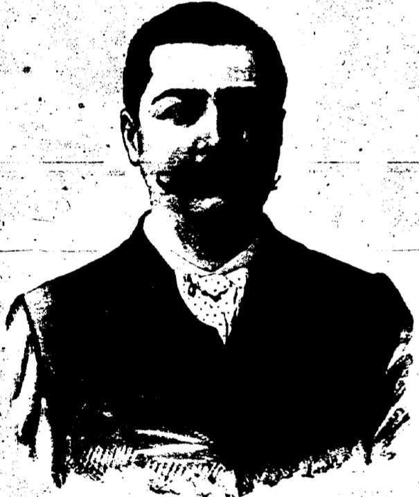
PRINCE ROLAND BONAPARTE.