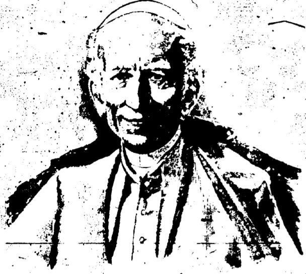
S. S. LE PAPE LÉON XIII. Portrait d'après Th. CHARTRAN.

Vin Mariani commandé pour Sa Majesté L'Empereur de Russie.