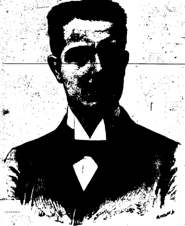
PRINCE HENRI D'ORLÉANS.

Monsieur Mariani, J'espère me pas avoir à faire usage de la longueur de votre vin Mariani, Les voyages en ont dit de si bons. Je n'ai pas fait une partie de ma vie que j'ai dû aller rechercher dans votre vin. Je n'en ai pas bien bien trouvé. Votre vin est à ma connaissance le plus distingué. Henri d'Orléans