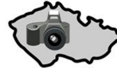
Foto českých obcí

Cesty fotografů v rámci třetího ročníku grantu 2010 – 2011