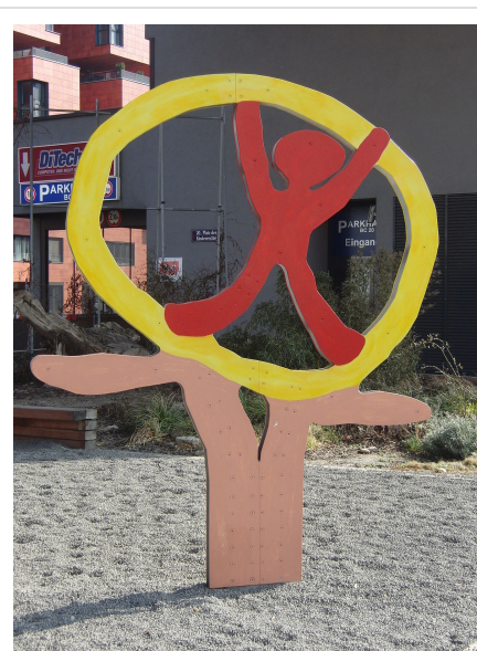
Escultura en el sitio de los Derechos del Niño en Viena, Brighton, Austria.