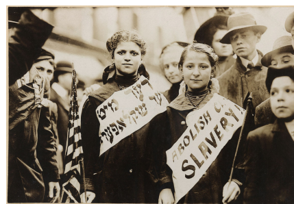
Activistas jóvenes pidiendo la abolición de la esclavitud infantil en Estados Unidos a principios de 1900.

A partir de 1975, con ocasión del Año Internacional del Niño, se comenzó a discutir una nueva declaración de derechos del niño, fundada en nuevos principios. A consecuencias de este debate, en 1989 se firmó en la ONU la Convención sobre los Derechos del Niño y dos protocolos facultativos que la desarrollan: