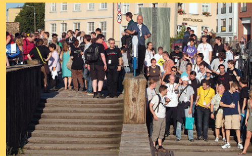
Ralf Roletschek, CC BY SA 3.0