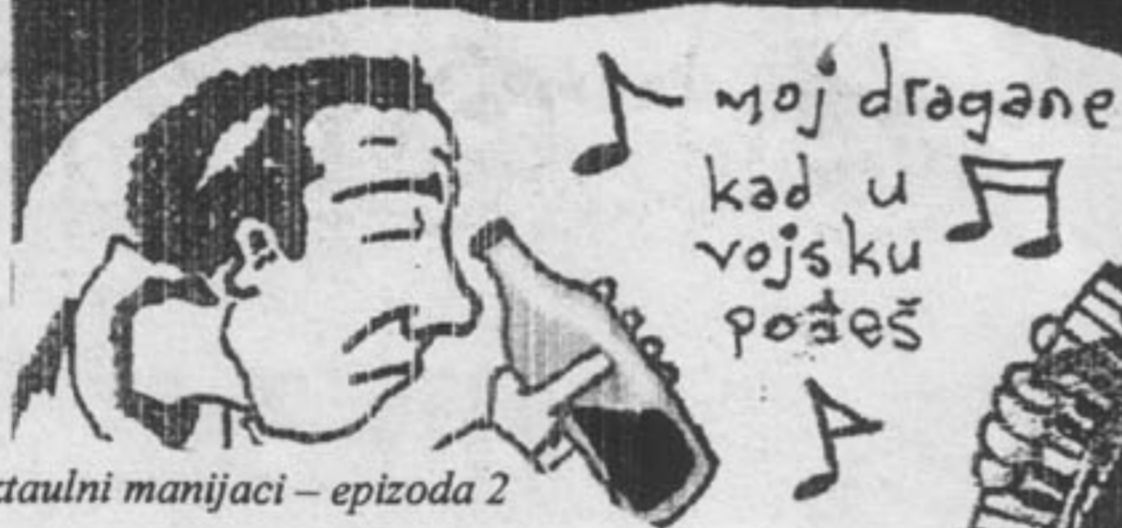
Intelektualni manijaci – epizoda 2