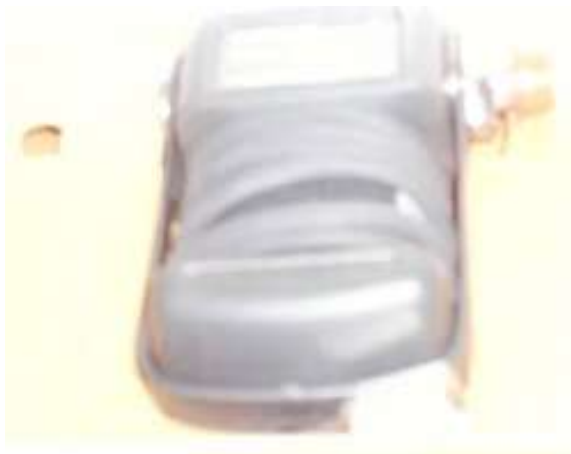
Capteur de pression