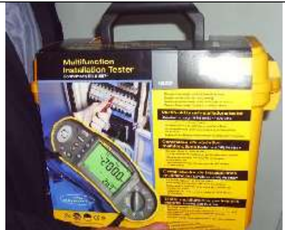
Testeur d'installation électrique NF C 15 – 100