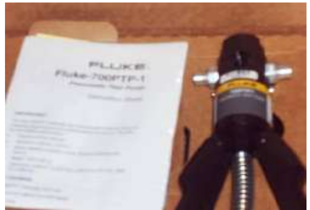
Pompe d'essai pneumatique