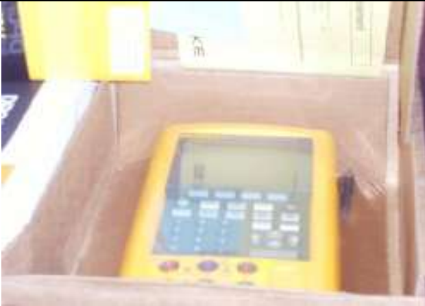
Calibreur Process Multifonctions