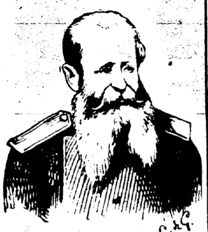
Mort du général Gourko.

Berlin, Allemagne, 29 janvier—Les fêtes qui devaient avoir lieu en l'honneur de l'anniversaire de la naissance de l'empereur Guillaume comprennent la nomination de baron Von Richtoven, secrétaire des affaires étrangères, en qualité de conseiller privé avec le titre de Thieltsch.