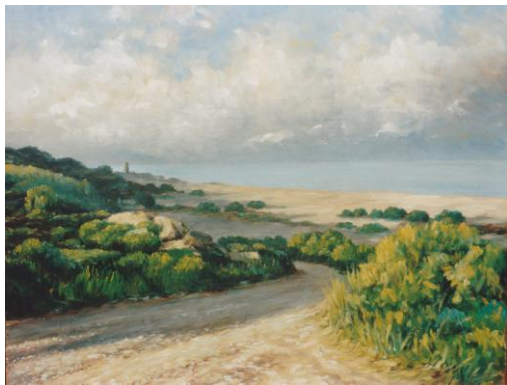
Camino de Torre Nueva