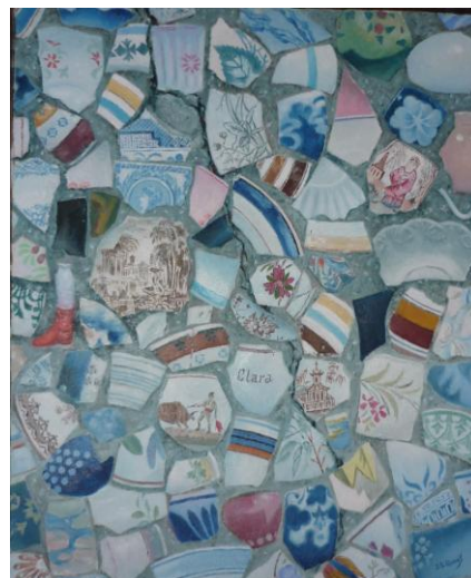
La casa de los chinitos