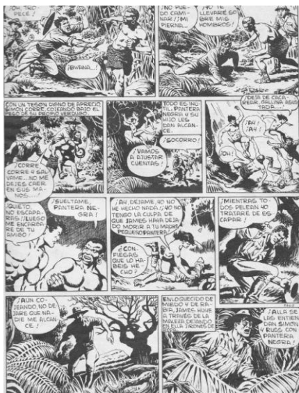
Pantera Negra (Editorial Maga)