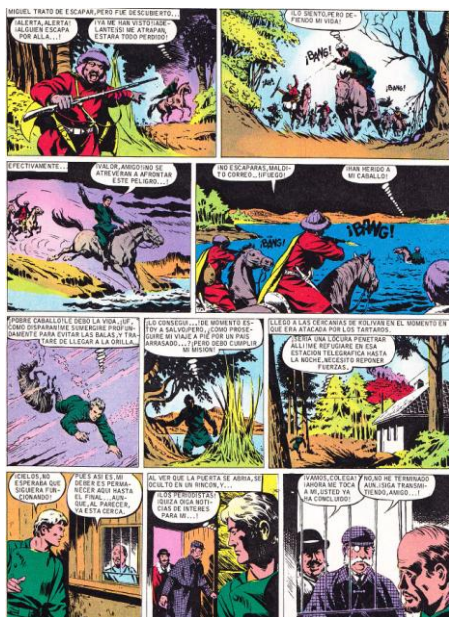
Miguel Strogoff (Editorial Brugera)

Más tarde tomó contacto con la barcelonesa Editorial Brugera con la que colaboró con la exitosa colección "Joyas Literarias" entre ellos su primer número "Miguel Strogoff" de Julio Verne. Además de continuar también la serie "el Sheriff King".