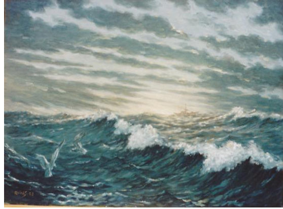
Amanecer en el mar