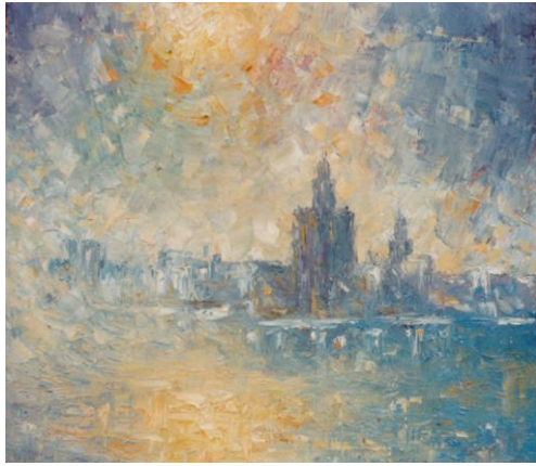
Torre del Oro