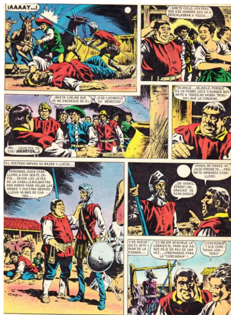
El Quijote de la Mancha (Editorial Brugera)