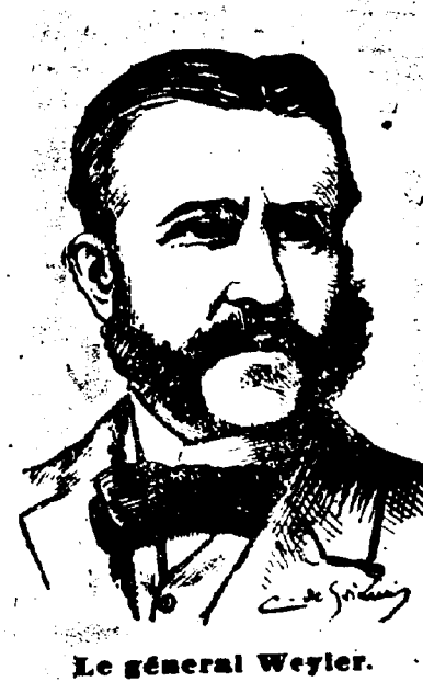
Le général Weyler.

Memphis, Tenn., 14 février.—Un léger tremblement de terre d'une durée de vingt secondes s'est produit à Memphis ce soir à six heures 15.