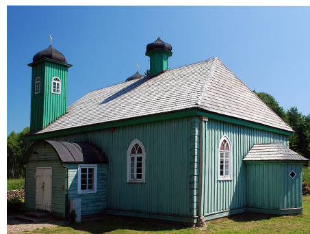
Meczet w Kruszynianach. Jedno ze zdjęć wykonanych w ramach "Wikiekspedycji".

Głównym językiem komunikacji między członkami społeczności jest angielski, w takim też języku opisuje się pliki, jak i galerie grafik. Jednakże możliwe są także opisy w innych językach. Polskojęzyczna społeczność posiada także miejsce do dyskusji, znajdujące się na stronie: