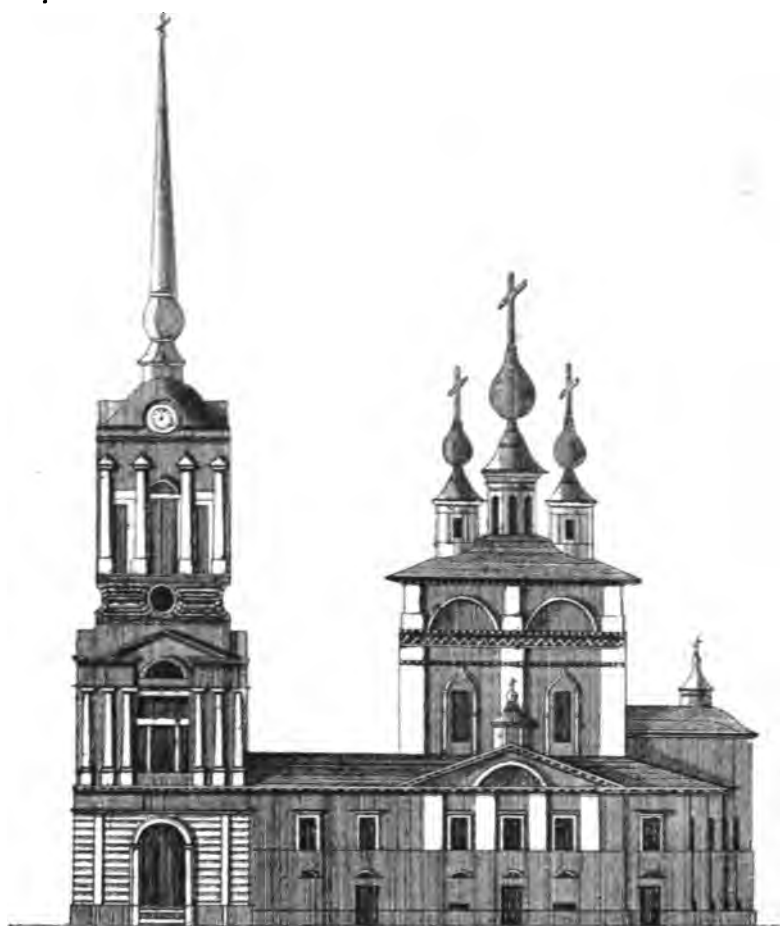
НЫНѢШНІЙ ВИДЪ СОЛВЫЧЕГОДСКАГО БЛАГОВѢЩЕНСКАГО СОВОРА