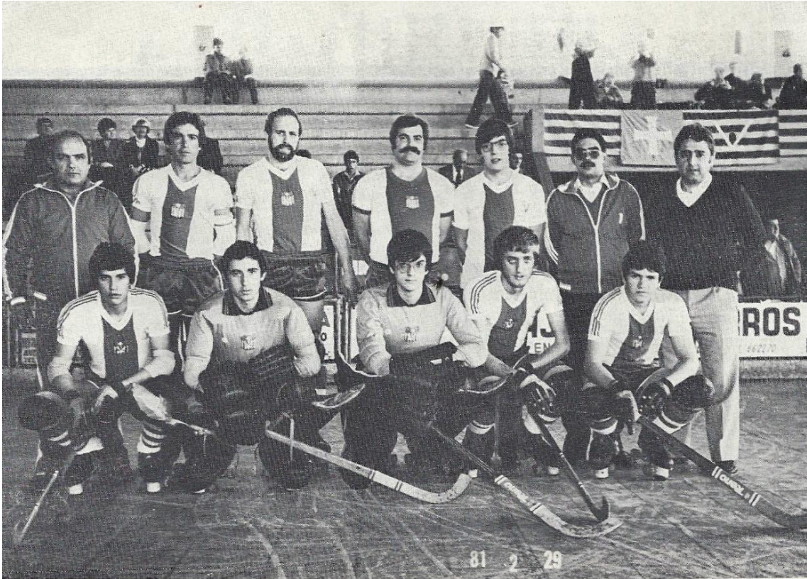
CAMPEÓN PRIMERA DIVISIÓN NACIONAL. Temporada 80-81.

Recuerdo con mucho cariño tus primeros pasos en el Hockey, ya que me honro en haber contribuido a prepararte en este camino deportivo, que ha resultado exitoso y lleno de logros, de los cuales todos nos sentimos orgullosos.