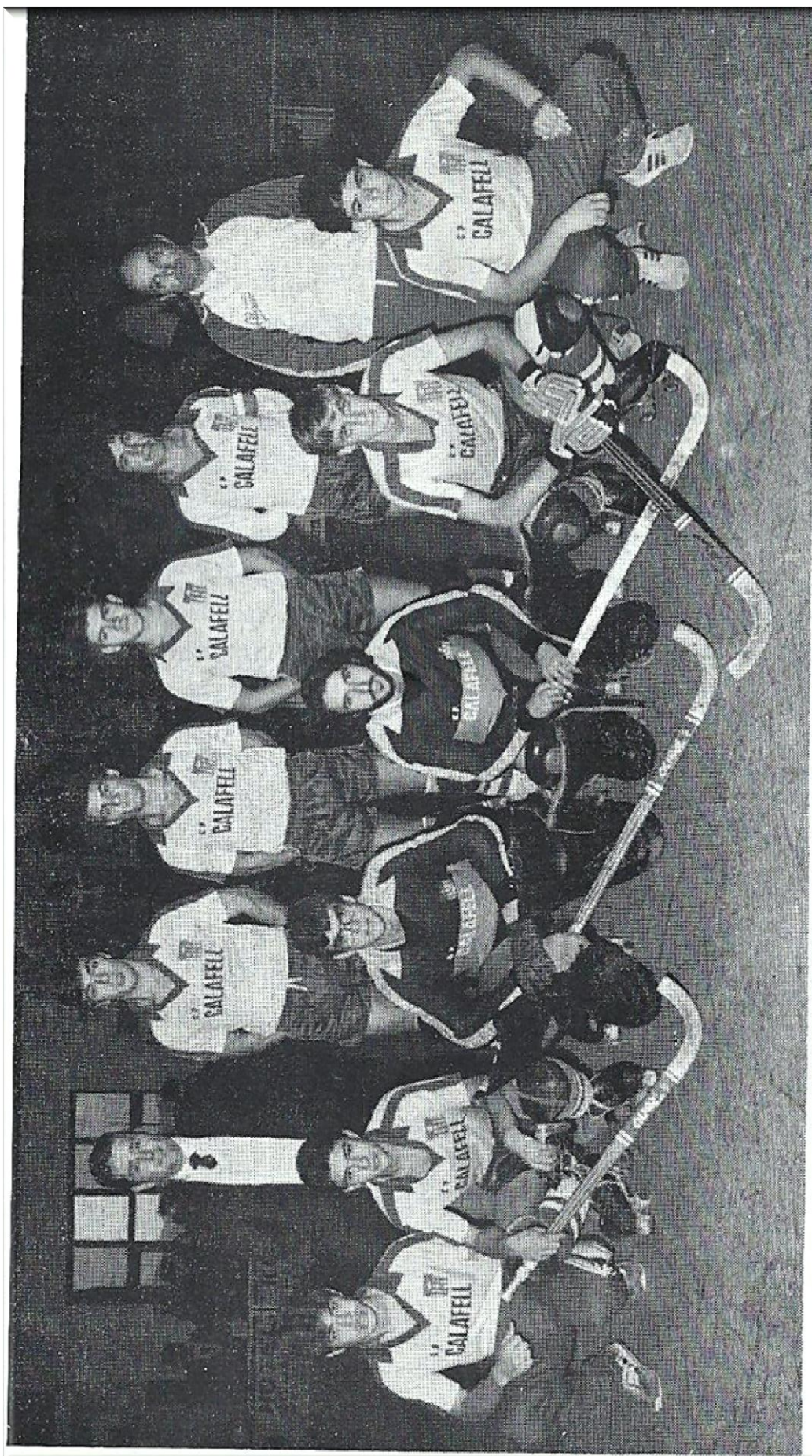
SUB-CAMPEÓN PRIMERA DIVISIÓN NACIONAL. Temp. 83-84.