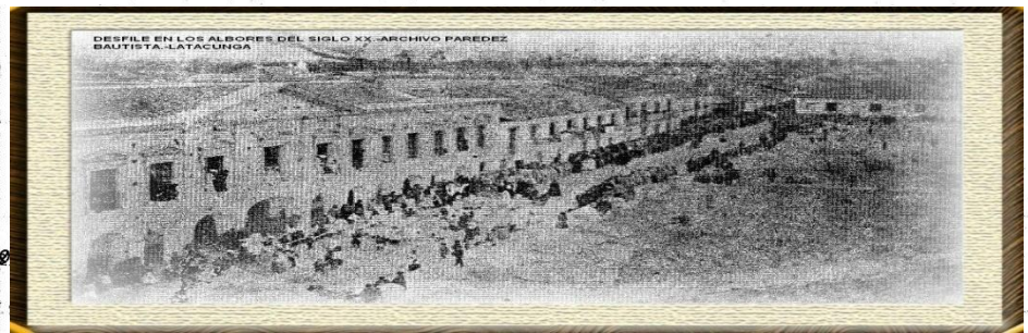
DESFILE EN LOS ALBORES DEL SIGLO XX - LATACUNGA