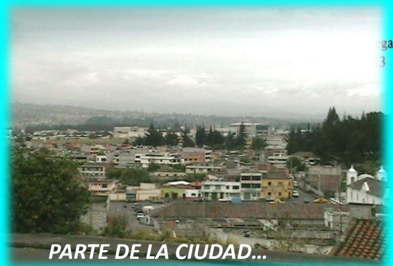
PARTE DE LA CIUDAD...

A continuación se lee: “Latacunga, febrero 23 de 1.831- Por recibido publíquese según se previene, y para que tenga su más exacto cumplimiento oficiese al Señor Vicario Juez Eclesiástico, acompañándole los respectivos ejemplares para que por su intermedio se haga trascendental a los Venerables Señores Curas para que practiquen las exequias necesarias y para que los habitantes lleven el luto por el término señalado y fije el día de su celebración en este cantón para la concurrencia de los Venerables Prelados y demás ciudadanos honrados (f) Joaquín Izurieta (Corregidor Accidental)”.