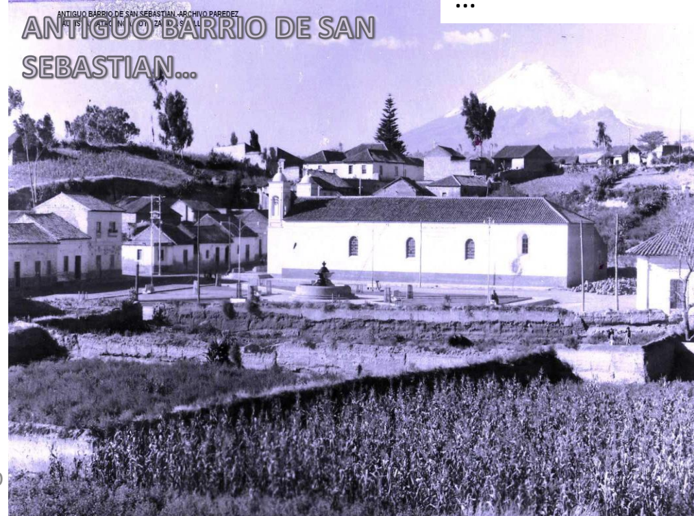
ANTIGUO BARRIO DE SAN SEBASTIAN... ANTIGUO BARRIO DE SAN SEBASTIAN ANTIGUO BARRIO DE SAN SEBASTIAN... ANTIGUO BARRIO DE SAN SEBASTIAN...

Poco antes de esta ultima situacion, los late- cunqueros atienden y rodean al señor Vice Presidente de la Junta Superior de Gobierno,