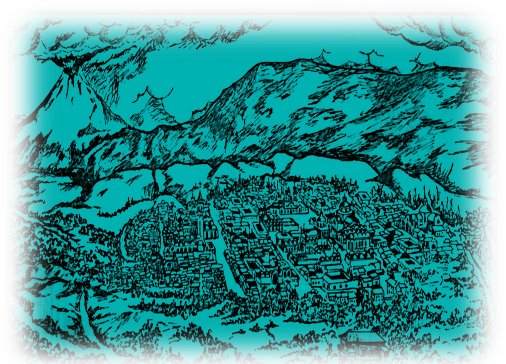
LATACUNGA COLONIAL.-AUTOR PATRICIO IZURIETA.-ARCHIVO PAREDEZ.