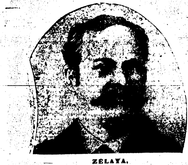
ZELAYA, Président de la République du Nicaragua.

Le quartier commerçant est rasé complètement. La perte est de $20,000.