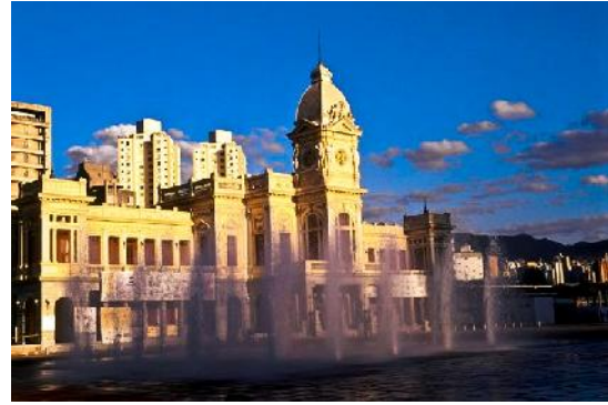
Praça da liberdade, Centro cultural de Belo Horizonte, Minas Gerais, Brasil.

Neste contexto cabe ao professor de Filosofia, o papel de estimular,