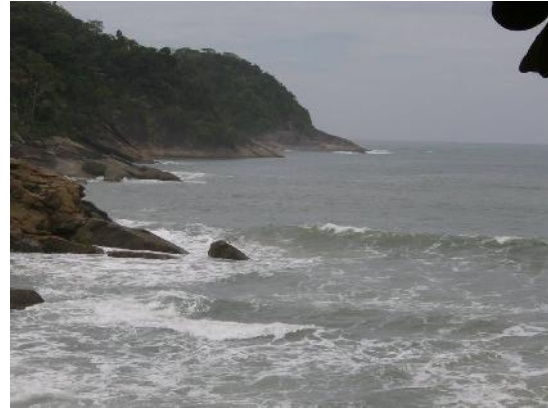
Trindade, São Paulo, Brasil.

A modo de preámbulo, esta exposición es el producto de mi trabajo de magistratura realizado durante el año 2004 en la U. de Chile, que se corresponde con uno de los tópicos realizados en esa tesis; además cabe señalar que justificado por el tratamiento de un autor como P.K.Feyerabend, se hace necesario justificar el hecho que la “obra” de este gran polemista se enmarca en una serie de investigaciones que buscan su cauce,