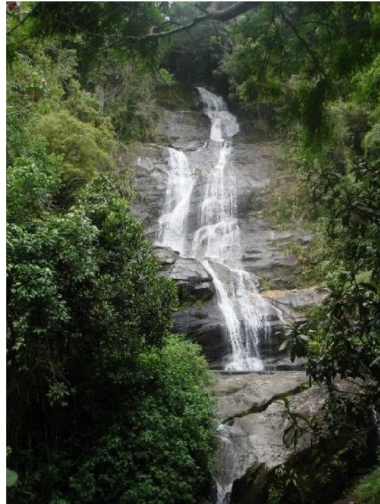
Floresta da Tijuca, Rio de Janeiro, Brasil. A maior floresta urbana do mundo.

Desde la perspectiva enunciada en el texto de Carlos Beorlegui 1 , el cual menciona que para poder problematizar adecuadamente la labor de una posible filosofía latinoamericana se nota a leguas que no es un problema que vaya descontextualizado o bien que no implique ulteriores