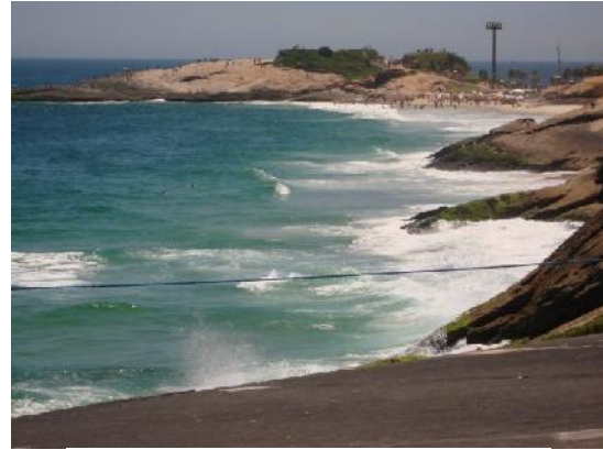
Praia de Copacabana, Rio de Janeiro, Brasil.

Tendo sido inicialmente propagado como “Calendário Maia” (ARGÜELLES, 2002: 140), 13