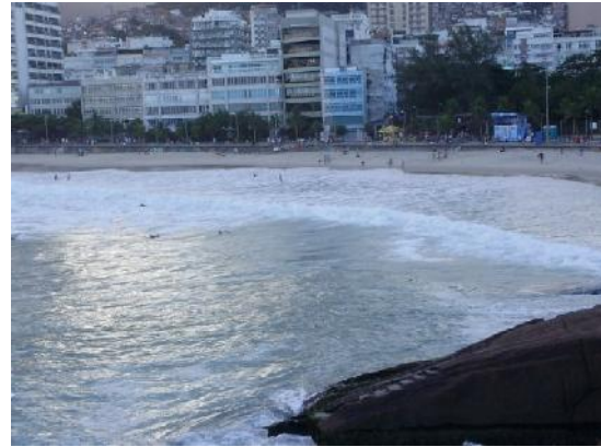
Pedra do Arpoador, Ipanema, Rio de Janeiro, Brasil.

A ntes de iniciarnos en la lectura del presente artículo queremos dejar en claro al lector, que no estamos ante una receta que proporciona soluciones acabadas, y que no se hace el acercamiento a la temática como filósofo, sociólogo,