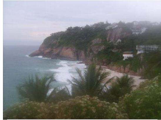
Playa de Joatinga, Rio de Janeiro, Brasil. Una playa que solo existe em verano... Cuando es posible bajar e quedarse em la arena.

Existe una postura muy difundida en la que la educación —en sentido laxo— es vía para aprender a resolver conflictos en entornos como el nuestro, en donde los conflictos son cotidianos, pero “¿Sería posible concebir una educación que permitiera evitar los conflictos o solucionarlos de manera pacífica, fomentando el conocimiento de los