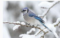
Equal third: Blue Jay ( Cyanocitta cristata ), taken