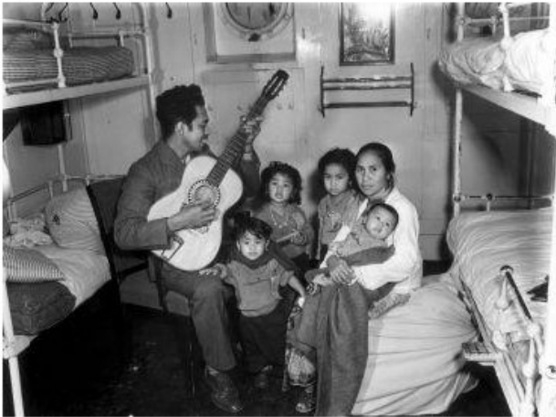
Repatrianten/spijtoptanten. Molukse familie maakt muziek aan boord van schip op weg naar Nederland. Plaats onbekend, 1951.