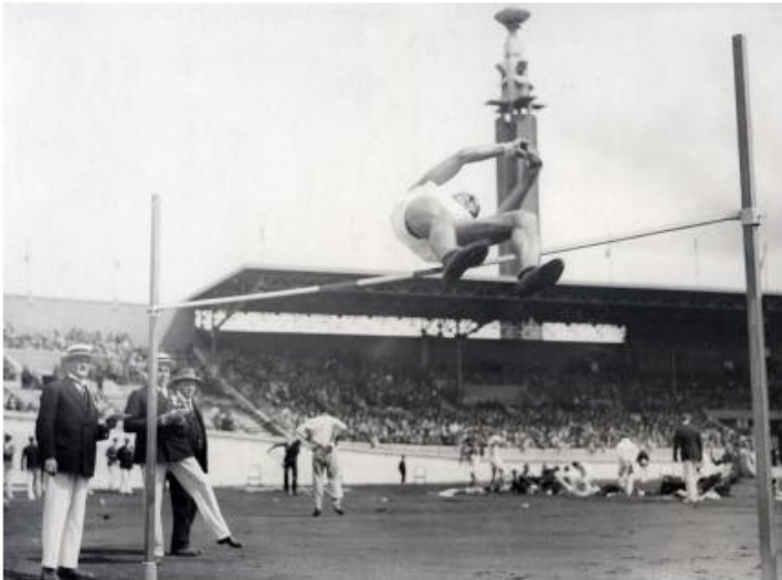
Sport, Olympische Spelen Amsterdam, 1928. Hoogspringer in actie.