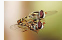
Equal third: Hoverflies ( Melangyna viridiceps )