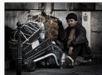
Second place: Sans domicile fixe in Paris,