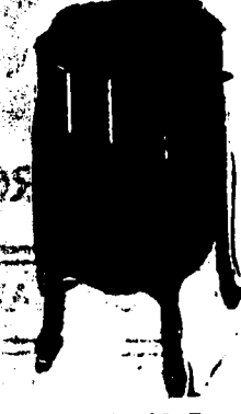
Victrola X, 10 Records. Prix $82.50. Conditions—Un quart comptant, le solde en six paiements mensuels égaux.