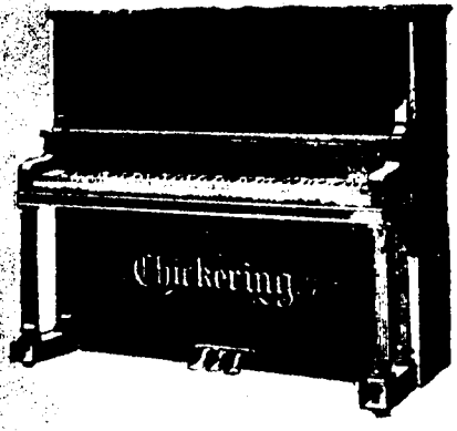
4 pieds 2 pouces droit, $500 comptant. Conditions—$12 par mois, 6 pour cent arajou. 4 pieds 6 pouces droit, $550 comptant. Conditions—$12.50 par mois, 6 pour cent arajou.