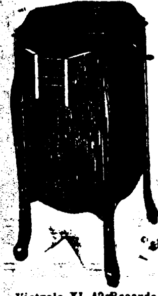
Victrola XI, 12 Records. Prix $109. Conditions—Un quart comptant, le solde en six paiements mensuels égaux.