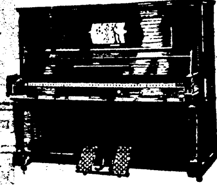
STEINWAY PIANOLA PIANOS, $1,250. Conditions—$20 par mois, 6 pour cent arajou.