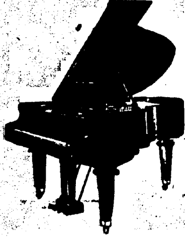
5 pieds Grand, $675 comptant. 5 pieds 7 pouces Grand, $725 comptant. 6 pieds 5 pouces Grand, $800 comptant. Conditions—$25 par mois, 6 pour cent arajou.