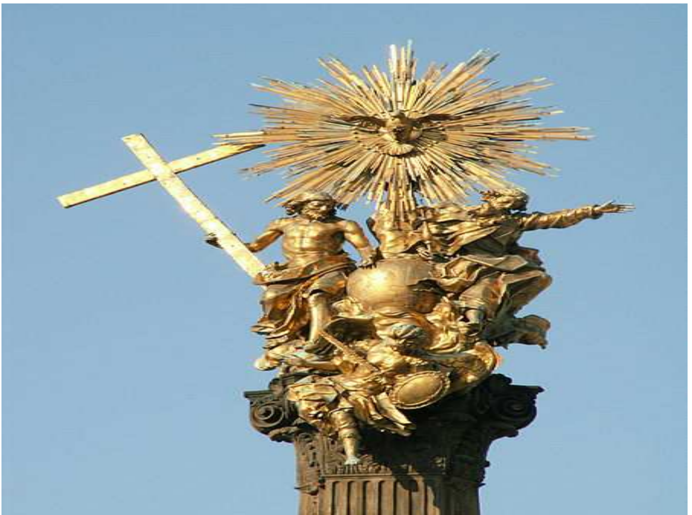
Sculptural group from the Holy Trinity Column in Olomouc , Czech Republic , 18th century