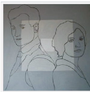
Eva M. Paar: Distanz (2004)

Zusätzlich wird durch den malerischen Hintergrund und eine zur Emotion passende Farbkomposition das im Gemälde oder in der Zeichnung dargestellte Gefühl verstärkt.