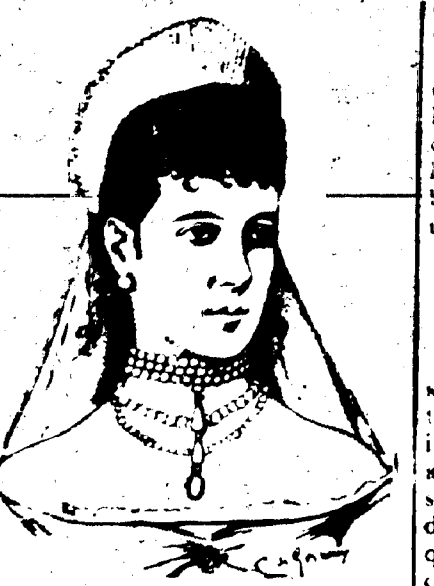
L'anniversaire de la Tsarine

St-Petersbourg, 7 juin — La ville est gaiement décorée aujourd'hui en l'honneur de l'anniversaire de l'Impératrice. Ceux qui espèrent que le jour serait marqué par une proclamation impériale ont été déçus.