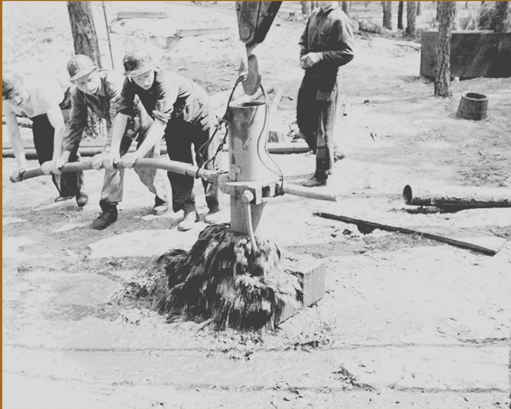
Gerät 441 : Einbau einer Rohrtour