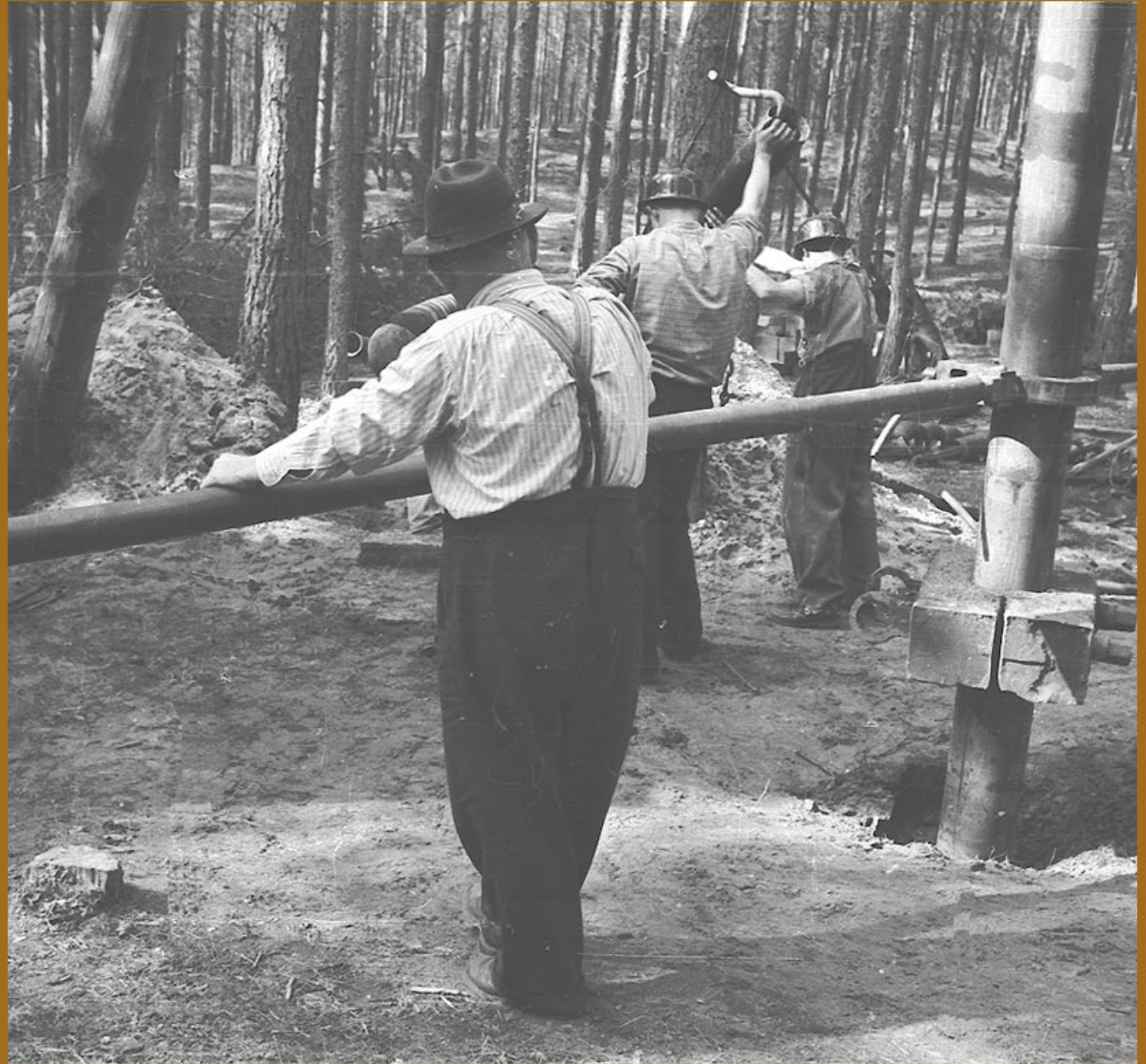
- hilft bei den Bohrarbeiten am Gerät 441: Schäferkran - .