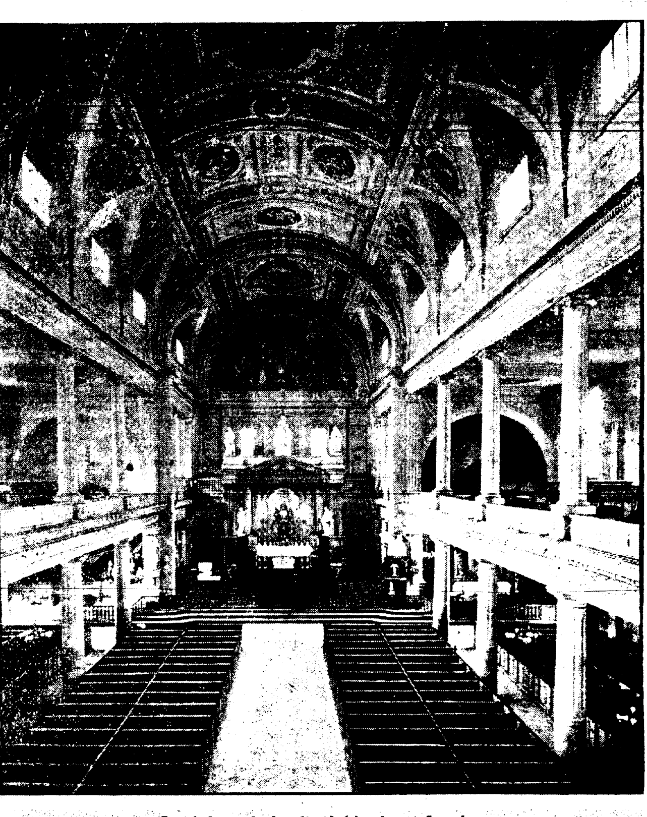
Intérieur de la Cathédrale St-Louis.

Depuis que M. A. Vezey, un enfant du pays, a pris la direction du West End, ce rendez-vous de plaisir semble avoir rejoint et pris vie nouvelle. Les exécutions y sont d'une grande variété et l'orchestre d'excellent ordre. Les pages les plus brillantes des compositions des grands maîtres, sont interprétées par des instrumentistes d'une rare valeur.