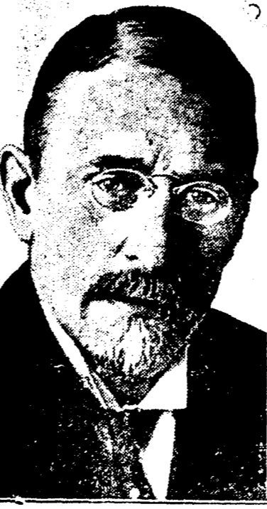
HENRY MORGENTHAU

We cannot refuse. Next to their faith in God is their trust in the disinterested good will and generosity of the American people.