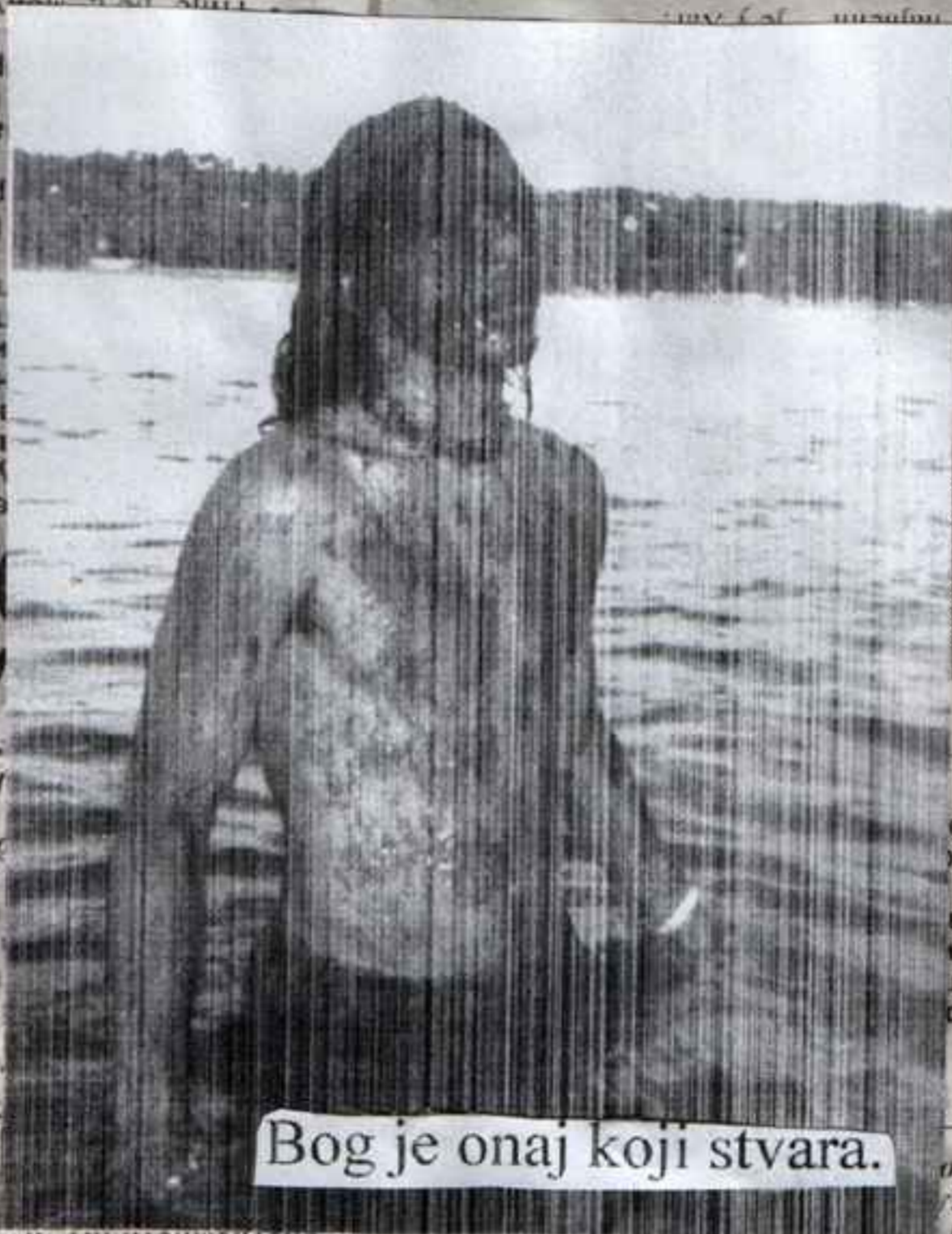
Bog je onaj koji stvara.