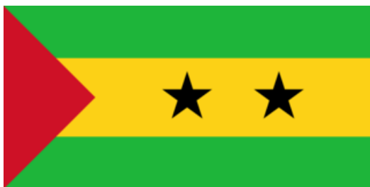
São Tomé e Príncipe