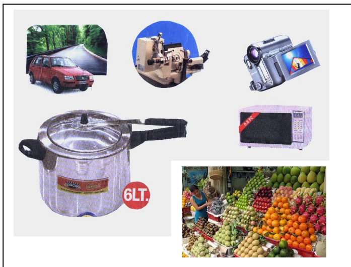
Figura-1: ¿Dónde estás las ciencias: La química, la física, la biología?