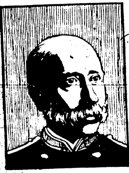
AMIRAL W. K. VAN REYDEN. Ancien chirurgien général de la marine qui a été président de la Société Américaine Nationale de la Croix Rouge.

NEW ORLEANS BEE PUBLISHING CO. LTD. 332 rue de Chartres. Entre Canal et Bienville