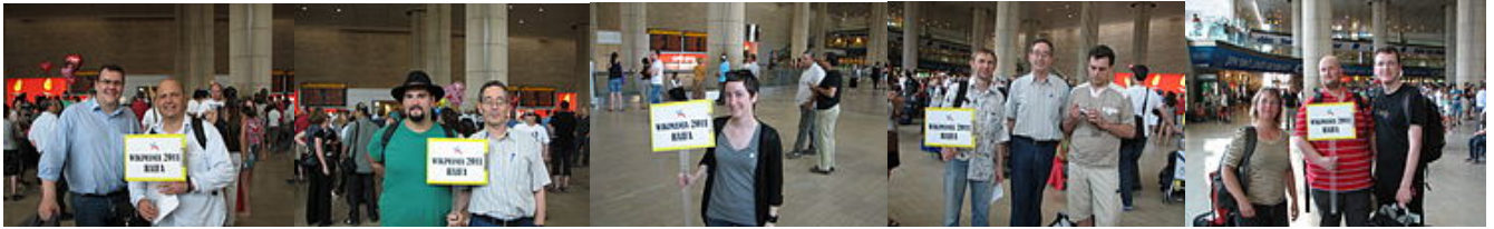
圖：有不同維基人均到達當地，在機場有人歡迎他們。

歡迎及接機在 8 月 1 日至 3 日，有來自不同地方的維基人到底當地，有歡迎的儀式。