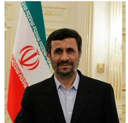
馬哈茂德·艾哈邁迪內賈德