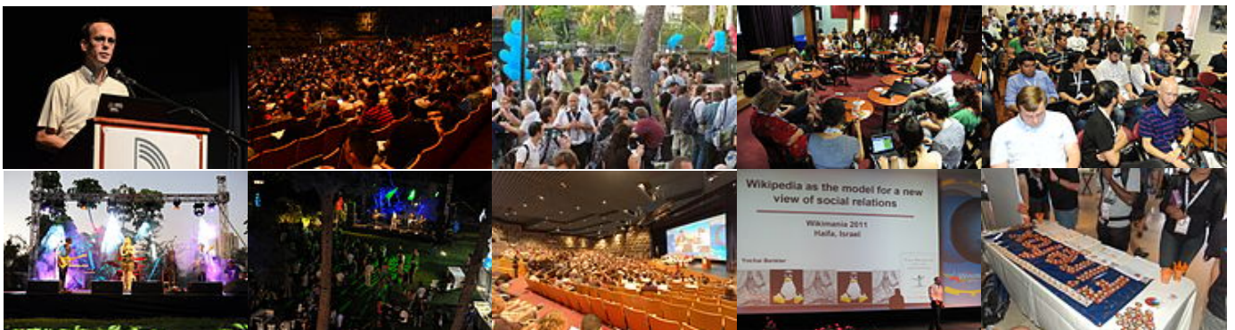
圖：1,2—開幕禮，3—聚集，4—坐談會及晚餐，5—會議，6,7—派對，8,9—演說，10—Firefox 標誌

8 月 4 日至 8 月 6 日一共三天進行了正式的會議，有講座、演說、坐談會、討論等節目。