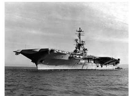
奧里斯卡尼號航空母艦