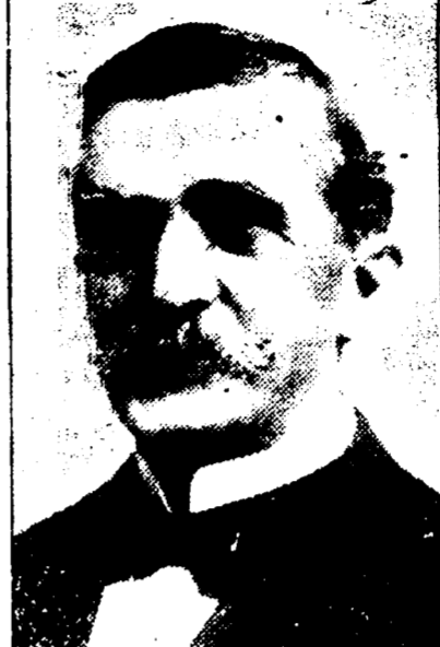
EMILE S. ECUYER Président de l'Union Française.

DATES DES REUNIONS — Réunions le premier jeudi de chaque mois.