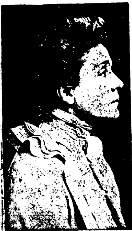
Maladie d'Elonore Duse.

New York, 17 février.—Elonore Duse, l'actrice, est sérieusement malade d'une pneumonie, dit une dépêche de Gènes à l'«American».