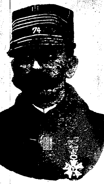
LE COMTE ESTERHAZY.

LA THENEE LOUISIANAIS. CONCOURS DE 1897. L'Athénée propose le sujet suivant aux personnes qui désirent prendre part au concours de cette année: «LOUIS XIV ET SON SIECLE».