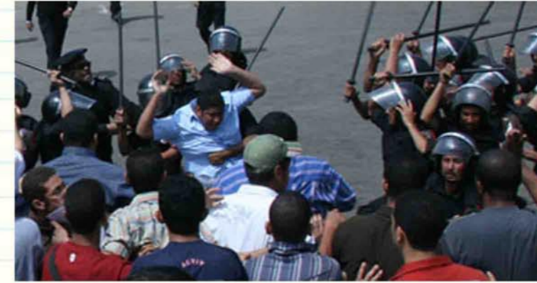
طلاب الإسكندرية يتبرعون

أكد أساتذة جامعة الإسكندرية، أن طلاب الجامعة من حقهم التعبير عن غضبهم حيال الاعتداء الإسرائيلي الفاشم تجاه أهالي غزة الأبرياء، وأن الجامعة لا ترفض أي تعبير حضاري من قبل الطلاب عن رفضهم لتلك الممارسات الإسرائيلية غير الإنسانية.