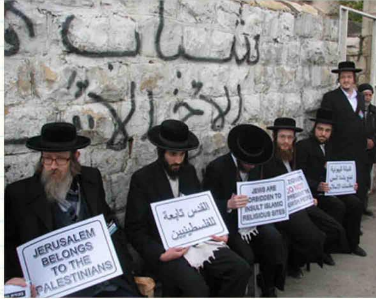
تعتقد الحركة بضرورة إقامة اليهود ضمن دولة فلسطينية على كامل التراب الوطني (الجزيرة نت)

واعتبر البيان الموقع بـ"ناطوري كارتا، فلسطين" أن الصهيونية لا يمكن لها أن تمثل بأي شكل من الأشكال الشعب اليهودي الحقيقي وهي لا تملك أي حق حتى على شبر واحد من الأرض المقدسة.