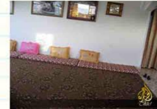
مكان استقبال الوفود