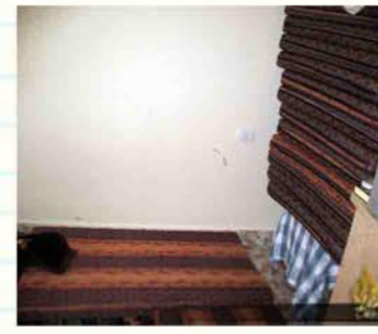
مكان جلوس العائلة