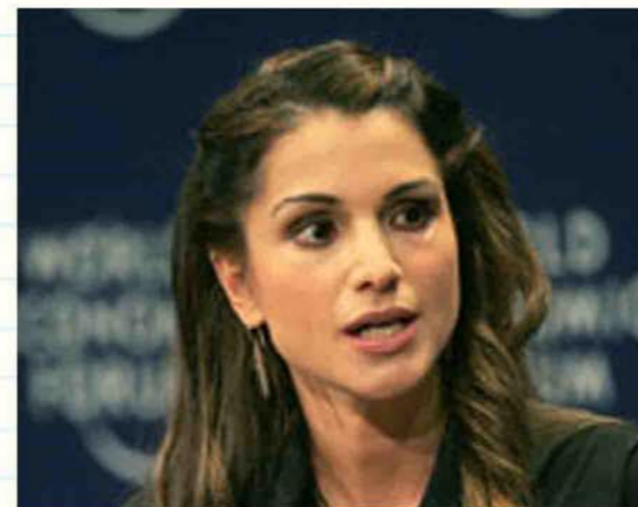
الملكة رانيا العبد الله تدعو لتوضيح القضية الفلسطينية للغرب (الجزيرة-أرشفيف)

وكانت عقيلة ملك الأردن كتبت مقالا نشرته الصحف المحلية الثلاثاء عبرت فيه عن حزنها الشديد على ما يتعرض له سكان قطاع غزة جراء القصف الإسرائيلي المتواصل منذ السبت الماضي.