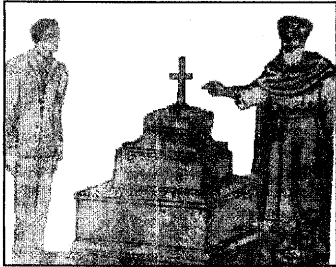
ዓወቀ በአባቱ መቃብር ላይ ጥርብ ደንጊያ በማቆሙ መምሬ ሰባጋዲስ እንደ ተቆጡ።

ዓወቀም ይህን በሰማ ጊዜ አባቱ ሆይ! በሆነው ባልሆነው ነገር ለምን ያስቸግሩኛል። በአባቱ መቃብር ላይ ቤት ብሠራ ከእንግዲህ ወዲህ አባቱ ተነሥተው አይበሉበት! አይጠጡበት! ተድላ ደስታ አያደርጉበት! ከዘመድና ከወዳጅ ጋር አይጫወቱበት! ለሰማቸው መቃብር እንደ ሆነ ያቆምሁት ደንጊያ እስከ ሺህ ዓመት ሳይጠፋ ይቆያል። የእንጨትና የግር ጉጆ ባቆምበት ግን ባሙቱ አርጅቶ ይወድቃል። ቤት ብሠራላቸው ትርፉ ምንድነው! ያውስ ቢሆን የእኔ አባት ነገሥ ወይም ጳጳስ አይደሉም። ደግሞም ብዙ ገንዘብ አላወረሱኝም እንጂ ብዙ ገንዘብ አውርሰውኝ በሆነ በኖራና ባሸዋ መልካም የመቃብር ቤት በሠራሁላቸው ነበር። ነገር ግን ያወረሱኝ ገንዘብ ጥቂት ስለ ሆነ ከቸግሬ አይተርፈኝም። ቢተርፈኝም እንኳ ለድጋ አመጸውትላቸዋለሁ እንጂ የመቃብር ቤት አልሠራም አላቸው።