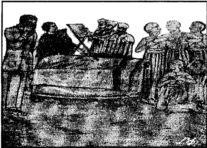
አቶ እንደ ልቡ ሞተው ካህናቱ ሲፈቱና ዘመዶቻቸው ሲያለቅሱ።

አቶ ዓወቀ ግን ወደ አልፍኝ ገባና የዘወትር ልብሱን አወለቀና ጥሩ ጥሩ የሆነ ኮትና ሱሪ ለበሰና፤ በግራ ክንዱ ላይ ትንሽ የጥቁር አጥላስ ቅዳጅ በመርፌ ሰፋና ዓይኑን በመሐርም ጠረግ ጠረግ አያደረገ በአባቱ ሬሳ አጠገብ ቆመ። በዚያ ጊዜ ቀሳውስቴም ግንዘት መድገማቸውን ትተው፤ ደብተሮችም መዋሥዕት መምራታቸውን ትተው፤ ዘመድ አዝማዱም ልቅሷቸውን ትተው ዓወቀን ያዩ ጀመረ።