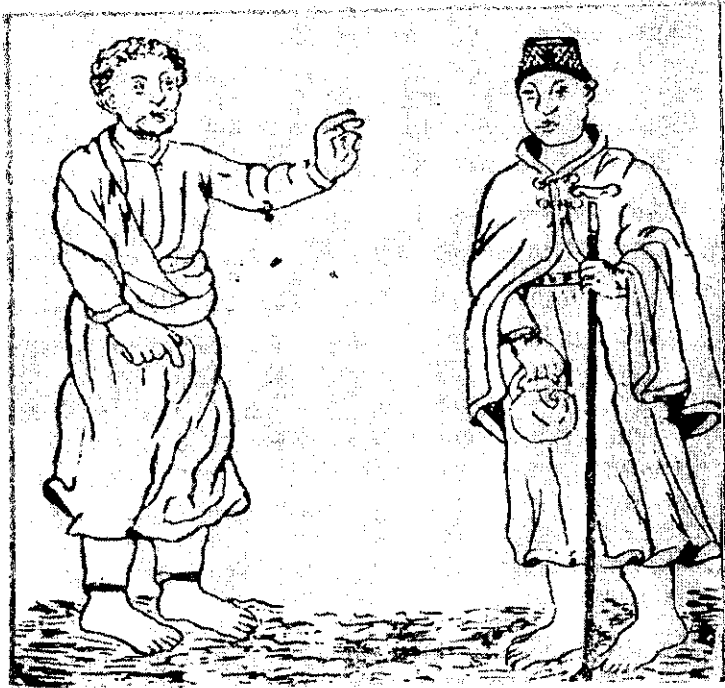
እማሆይ ወለቱ ለጠበል ወደ ደብረ ሊባኖስ ሲወርዱ ብርሃኔ ወደ ጸዮን ሞገሳ እንደ ላካቸው።

እማሆይም የብርሃኔን የልቡን አሳብ ሳያውቁ የቃሉን ንግግር ብቻ ለምተው አሁንም የተናገርኸው ሁሉ እርግጥ ነው። እንግዲህ ነገ ማለዳ መነሣቱ ነውና ደህና ለንብት አሉት።