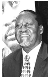
(Foto: Il presidente Kibaki e il capo dell'opposizione Odinga)

evidente e finora si son raggiunti i 350 morti e 100.000 sfollati: per risarcire a questi ultimi lo Stato dovrebbe spendere una somma equivalente a circa 5 milioni di euro.