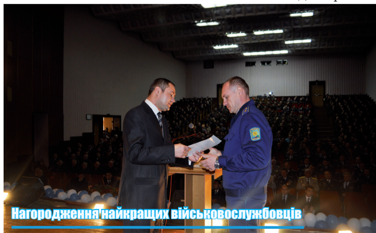
Нагородження найкращих військовослужбовців