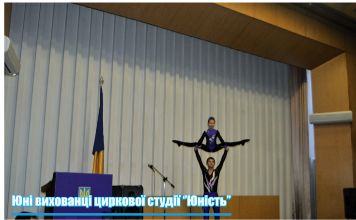
Юні вихованці циркової студії "Юність"