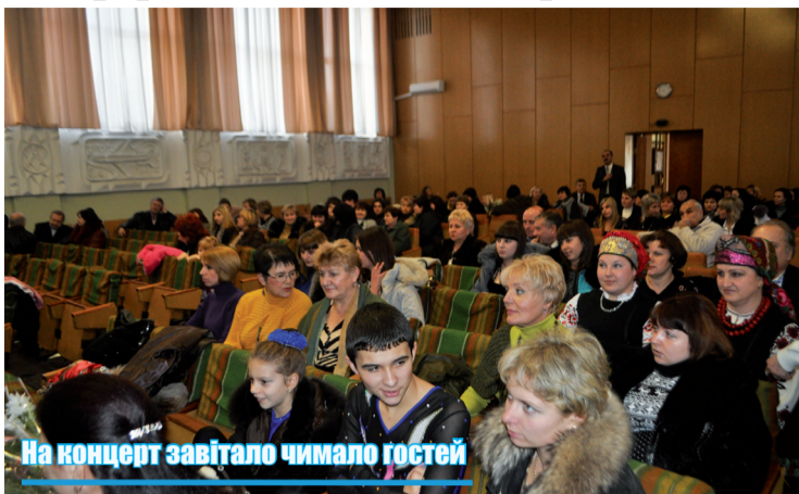
На концерт завітало чимало гостей

Нелегко знайти на сторінках календаря день, на який припадало б кілька великих свят. Але можливо. Сьоме грудня належить саме до таких непересічних дат, коли, з одного боку, православні християни вшановують пам'ять святої великомучениці Катерини, а з іншого — кожен громадянин, який працює в