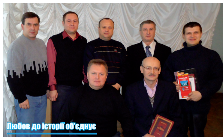
Любов до історії об'єднує

«Вікімедіа Україна» Ю.Й.Пероганич. За його словами, Вікіпедія – найпопулярніший серед відвідувачів сайт у мережі інтернету, адже 45 мільйонів сторінок переглядаються щомісяця, або 17 – щосекунди. Крім того, україномовна Вікіпедія посідає чотирнадцяте місце в світі серед 280 різномовних Вікіпедій. Зараз тут міститься 330 тисяч статей (для порівняння – у Великій радянській енциклопедії