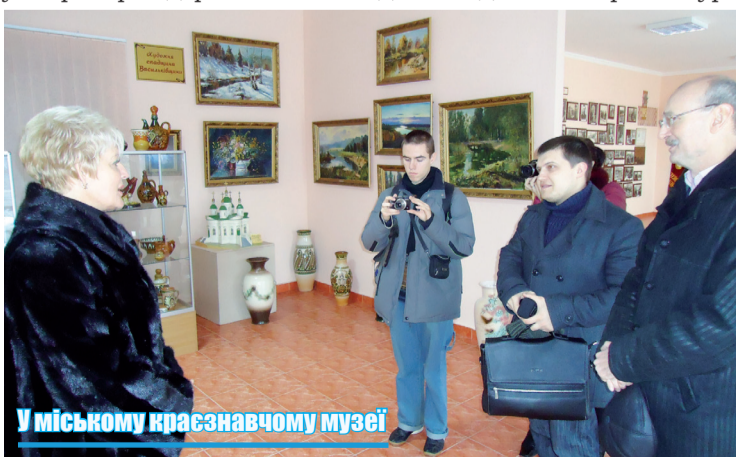
У міському краєзнавчому музеї

ного району: фотографували цікаві краєвиди, пам'ятки історії та гарні будівлі. Потім ці світлинки з відповідним історичним поясненням розміщують у Вікіпедії – міжнародній інтернет-енциклопедії. Є.В.Букет планує наступного року охопити третину території держави, а за два роки – завершити фотофіксацію всіх архітектурних та природних пам'яток України. Для цього проводитимуться так звані експедиції вихідного дня, будь-хто може брати в них участь, достатньо лише зареєструватися та приїхати вчасно до місця збору делегації. Більш конкретно про Вікіпедію розповів виконавчий директор українського представництва фонду