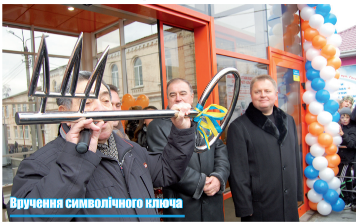
Вручення символічного ключа

Нещодавно на вулиці Соборній, 64/1 звели нову сучасну будівлю. В цій новобудові розмістився супермаркет «Сільпо», котрий урочисто був відкритий 10 грудня. Організатори церемонії відкриття запросили на дійство представників творчих колективів, які розважали численну публіку, яка, незва-