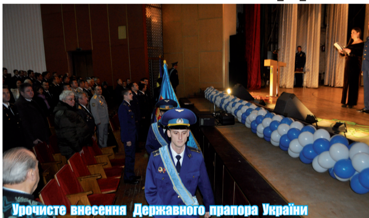
Урочисте внесення Державного прапора України

Також були присутні представники міста та Васильківського району, а саме: заступник Васильківського міського голови