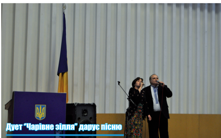
Дует "Чарівне зілля" дарує пісню

наполеглива і самовіддана праця, яка базується на високому професіоналізмі і компетентності, відповідальності й активній громадській позиції, є гідним внеском у розбудову рідного Василькова й України, та побажав їм, щоб кожен день у житті приносив тільки радість, добро, спокій і мир, а постійними супутни-